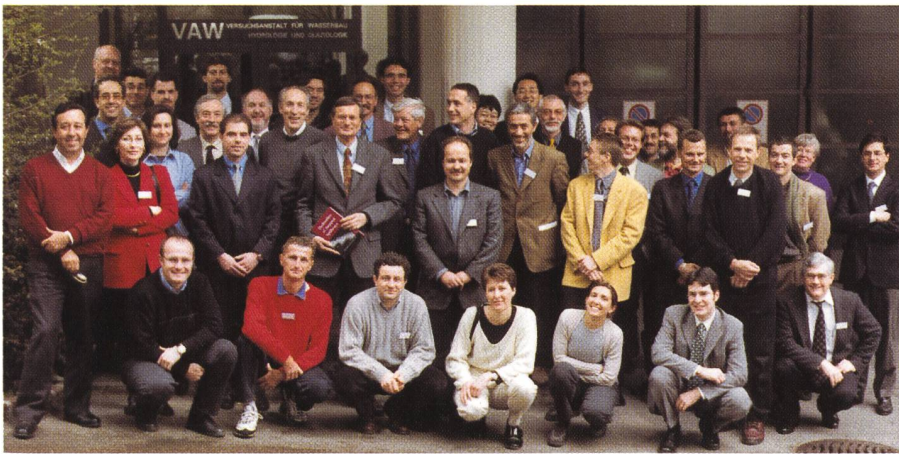
Bild 1. Teilnehmer des Workshops.

Der erste Workshop Hydraulics of Stepped Spillways an der Versuchsanstalt für Wasserbau, Hydrologie und Glaziologie (VAW) wurde von rund 50 Forschern, Ingenieuren und Studenten aus vier Kontinenten besucht. Alle 24 in den Proceedings enthaltenen Artikel wurden präsentiert und lassen sich dem von Balkema, Rotterdam, gedruckten Buch entnehmen. Das Buch hat die Nummer ISBN 90 5809 135 X und kostet 75 Euro. Die Themen des Workshops waren: 1. Fallbeispiele, 2. Belüftungscharakteristika und Kavitationsrisiko, 3. Energiedissipation, 4. Interne Abflusseffekte, und 5. Bemessung von Kaskadenschussrinnen. Als Schlussfolgerung wurde festgehalten, dass weitere Forschungsarbeiten auf diesem Gebiet notwendig sind, um allgemeine Bemessungsrichtlinien für Kaskaden aufzustellen. Das Foto zeigt die Workshop-Teilnehmer vor dem VAW-Gebäude.