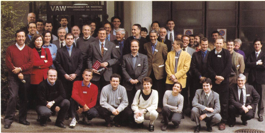
Bild 1. Teilnehmer des Workshops.

Der erste Workshop Hydraulics of Stepped Spillways an der Versuchsanstalt für Wasserbau, Hydrologie und Glaziologie (VAW) wurde von rund 50 Forschern, Ingenieuren und Studenten aus vier Kontinenten besucht. Alle 24 in den Proceedings enthaltenen Artikel wurden präsentiert und lassen sich dem von Balkema, Rotterdam, gedruckten Buch entnehmen. Das Buch hat die Nummer ISBN 90 5809 135 X und kostet 75 Euro. Die Themen des Workshops waren: 1. Fallbeispiele, 2. Belüftungscharakteristika und Kavitationsrisiko, 3. Energiedissipation, 4. Interne Abflusseffekte, und 5. Bemessung von Kaskadenschussrinnen. Als Schlussfolgerung wurde festgehalten, dass weitere Forschungsarbeiten auf diesem Gebiet notwendig sind, um allgemeine Bemessungsrichtlinien für Kaskaden aufzustellen. Das Foto zeigt die Workshop-Teilnehmer vor dem VAW-Gebäude.