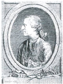
Antoine de Chézy