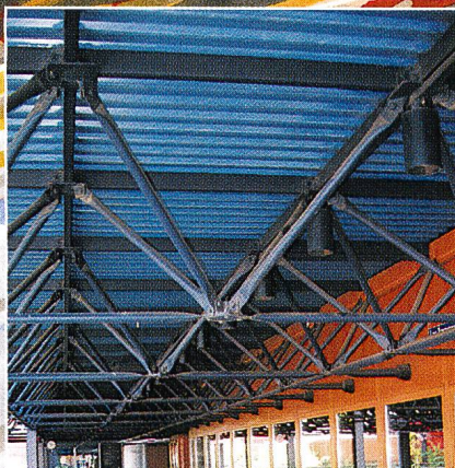
Fachwerkkonstruktion EPFL in Ecublens

Langlebiger Korrosionsschutz spart Ihnen Geld. Mit über 75-jähriger Erfahrung bieten wir Ihnen umfassendes Fachwissen, eine erstklassige Ausführung und höchste Zuverlässigkeit. Je nach Grösse und Art des Objektes arbeiten wir direkt vor Ort oder behandeln die Teile in unserem Werk.