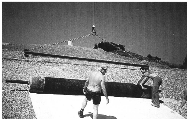
Bild 2. Ausrollen der Dichtungsmatte.