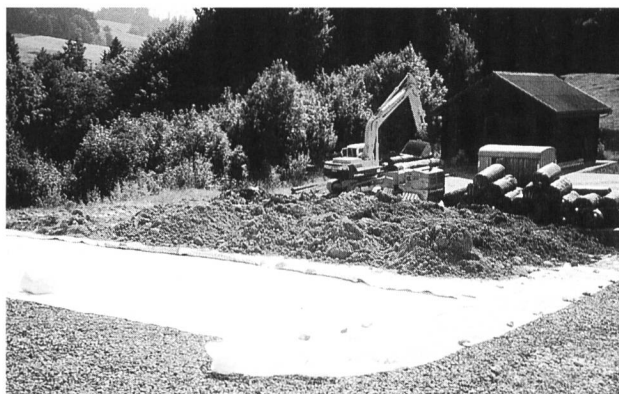
Bild 3. Schüttung der Rekultivierungsschicht.

be wurde die Deponie bis in die 70er Jahre mit Hausmüll gefüllt. Die Schütthöhe beträgt rund 20 m.