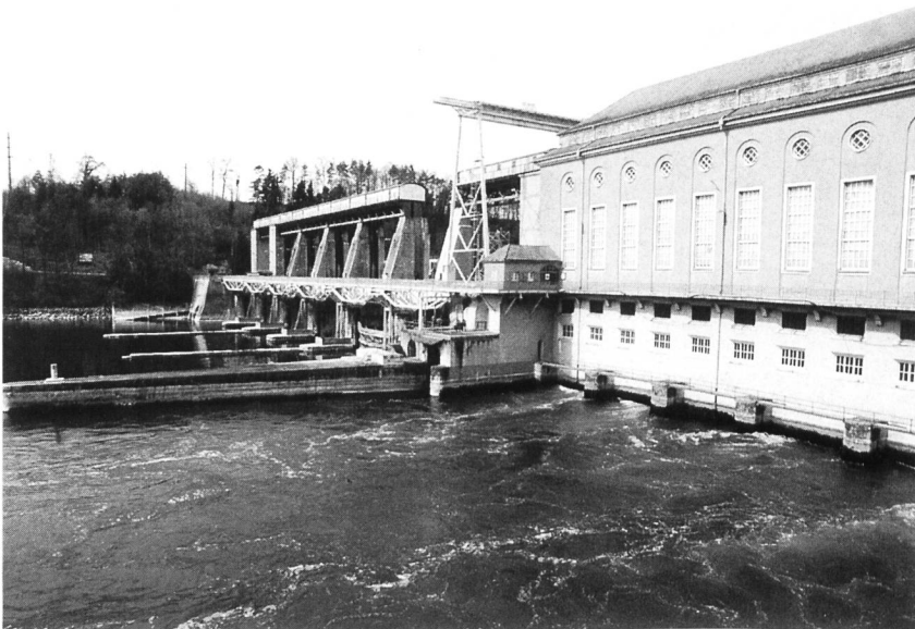
Bild 1. Kraftwerk Eglisau. Maschinenhaus und Stauwehr vom Unterwasser aus. 1993 bis 2000 Sanierung der Wehrpfeiler und Windwerkbrücke des Stauwehrs. Konzessionsprojekt 1997: Totalrevision der sieben Maschinengruppen bei gleichzeitiger Erhöhung des Wirkungsgrades und der Ausbauwassermenge; dies ermöglicht eine Produktionssteigerung um rund 22 %.

Nordostschweizerische Kraftwerke, NOK, CH-5401 Baden (5. Juni 1997).