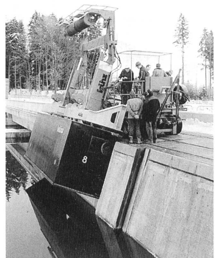
Bild 2, rechts, zeigt den Kran beim Einsetzen eines Dammbalkens.