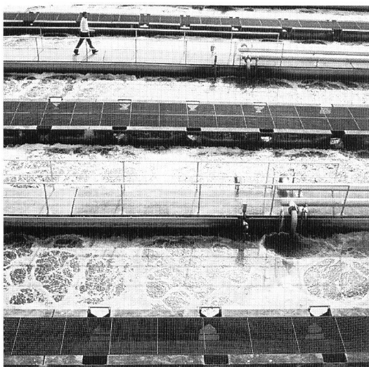
Bild 1. Belüftungsbecken einer Kläranlage mit Tiefenbelüftung.