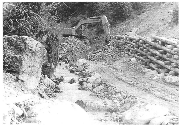
Bild 2. Die massiven Holzkastenwuhren werden mit Bruchsteinen und erdigem Aushubmaterial aufgefüllt und überdeckt. Die schweren Vorbausteine schützen nicht nur die Holzkastenwuhren vor Beschädigungen durch Hochwasser, sie bieten auch Forellen und Kleintieren gute Unterschlupfmöglichkeiten. Diese aus natürlichen Materialien erstellten Verbauungen sorgen künftig für eine Stabilisierung des Rutschhangs im Uferbereich und für einen ungehinderten Durchfluss des Schmuerbach-Wassers.

Die unterhalb des Dorfs Panix befindliche Verbauung hat die Aufgabe, den Uferbereich einer seit vielen Jahrzehnten als Rutschhang bekannten Talflanke der Schmuerbachschlucht im Bereich des Bachbetts zu stabilisieren. Seit dem Aufstau des Panixersees ist die Wasserführung des Bergbachs relativ konstant. Hochwasserspitzen werden in der Regel durch den Speichersee ausgeglichen. Dennoch muss auch weiterhin mit starken Hochwasserabflüssen ge-