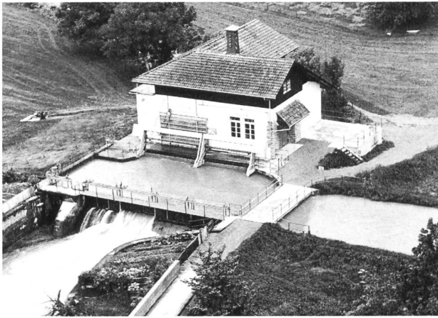
Von der Planung bis zur Installation von zu modernisierenden und neuen Kleinwasserkraftwerken im Leistungsbereich bis 5000 kW ist eine Domäne der ABB Mittelspannungstechnik AG. Das Bild zeigt das KW Hürlimann der K. Hürlimann Söhne AG in Brunnen (SZ), das vor einiger Zeit durch ABB komplett modernisiert und automatisiert wurde.

fortschreitende Industrialisierung und gewinnen heute bei der weltweiten Verknappung der Energieressourcen und dem steigenden Umweltbewusstsein ständig an Bedeutung. Kleine bis mittlere Anlagen leisten noch heute einen wichtigen Beitrag an die Energieversorgung der Schweiz.