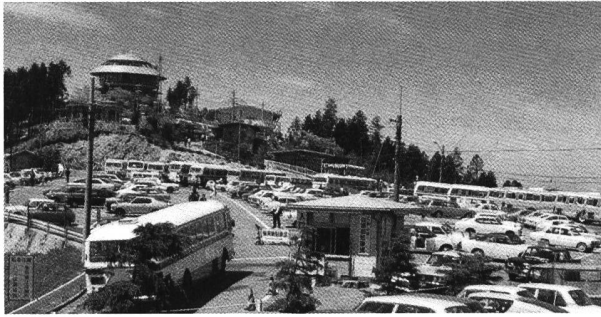
Figure 8. Cars of visitors of the Observation Tower Mt. Hiei.

protecting a shore village of purely Japanese style houses, are often carelessly replaced by modern structures. Most Japanese rural communities are still economy-oriented and development-minded, while the concern on natural beauty and harmonious landscape as common social properties is only slowly growing. Have we to wait for some time till our mentality is improved or could we manage to accelerate its progress?