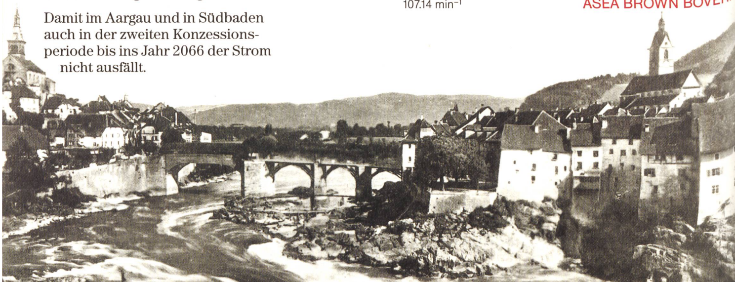
ABB ASEA BROWN BOVERI

Asea Brown Boveri AG Bereich Wasserkraftwerke Abteilung KWHV CH-5401 Baden/Schweiz Telefon 056/94 68 63 Fax 056/94 74 10