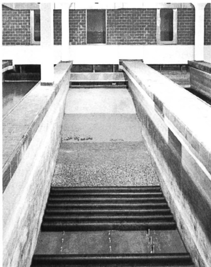
Bild 2. Sulzer-Drainagefilterboden in der Wasserversorgung Zürich.