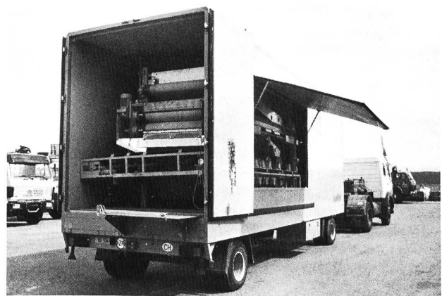
Eine Von-Roll-Siebbandpresse auf einem Anhänger kommt seit 1. Februar 1987 in der Region «Terre Sainte» zum Einsatz. Die Gemeinden Commugny-Coppet, Mies-Tannay, Founex-Céligny, Chavannes-de-Bogis/Bogis-Bossey und Prangins haben diese mobile Anlage gemeinsam angeschafft, um die Kosten für die Schlamm entwässerung tief zu halten.

Von Roll hat eine Siebbandpresse entwickelt, die in erster Linie auf die spezifischen Bedürfnisse der Schweizer Abwasserreinigungsanlagen ausgerichtet ist. Im Vordergrund stehen unter anderem die hohe Leistungsfähigkeit, der geringe Betriebsmittelverbrauch (Chemikalien und Strom), einfache Bedienung und Wartung sowie niedrige Investitionskosten. Sie besitzt eine einfache Konstruktion und gewährleistet eine hohe Betriebssicherheit verbunden mit problemloser Bedienung und Wartung. Es handelt sich um