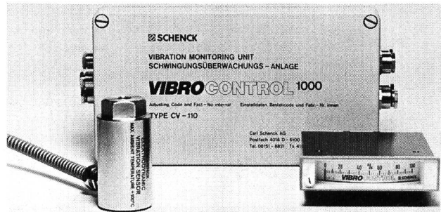
Die Schwingungsüberwachungsanlage Vibrocontrol 1000.

Neben hoher Leistungsfähigkeit wird bei Vibrocontrol 2000 besonderer Wert auf Betriebssicherheit gelegt. Zur Vermeidung von Fehlalarmen ist das System mit umfangreichen Schutzschaltungen ausgestattet, die selbsttätig Störungen in den Schwingungsaufnehmern und der Versorgungsspannung erkennen und melden. Einmalig ist