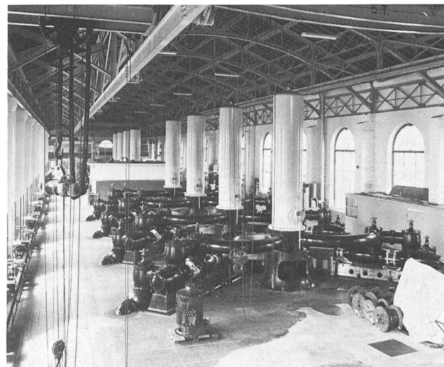
Bild 1. Ansicht auf einige Pumpen-Aggregate des Pionier-Pumpwerks «La Coulouvrenière» der Stadt Genf.

Des stark wachsenden Bedarfs wegen musste die Anlage bereits 1901 mit zwei elektrisch angetriebenen Turbopumpen von Sulzer ergänzt werden. Übrigens waren es die ersten zweistufigen Hochdruckpumpen, die bei Sulzer gebaut wurden. Die Räder wurden symmetrisch angeordnet, um die Axialschübe auszugleichen (Förderleistung 380 l/s bei 14 bar). Heute fördert das Werk «La Coulouvrenière» weiterhin Trinkwasser aus dem Genfersee – nun filtriert – in das Stadtnetz.