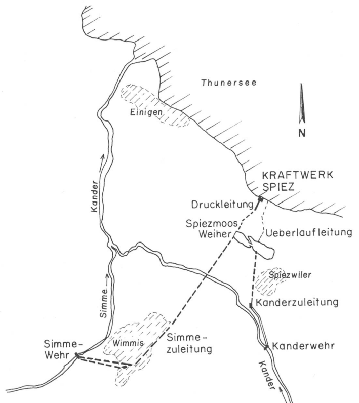
Bild 1. Übersichtsskizze Kraftwerk Spiez im Massstab von etwa 1:60000.

Das Versorgungskonzept der SBB und der BLS sieht in Zukunft andere Möglichkeiten als den Strombezug aus den Kraftwerken Spiez und Kandergrund. Deshalb werden in den erneuerten Kraftwerken ausschliesslich Dreiphasen-Wechselstrommaschinen installiert.