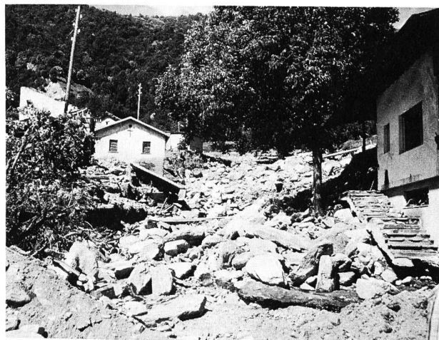
Figura 2. Torrente straripato nell'anno 1978, Valle di Blenio presso Marolta, Cantone Ticino.