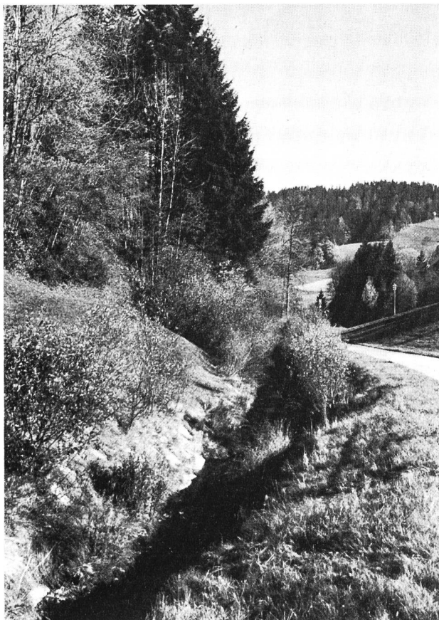
Figura 1. E inevitabile che dei corsi d'acqua vengano toccati da vie di comunicazione e debbano essere corretti. In questi casi bisogna tendere ad una sistemazione al più possibile conforme alla natura del profilo trasversale e del tracciato; si raccomanda inoltre di piantare una siepe di separazione.

Essa si rivolge a tutti gli interessati, in primo luogo ai progettisti, agli uffici competenti ed alle istanze cui spetta il preavviso in materia.