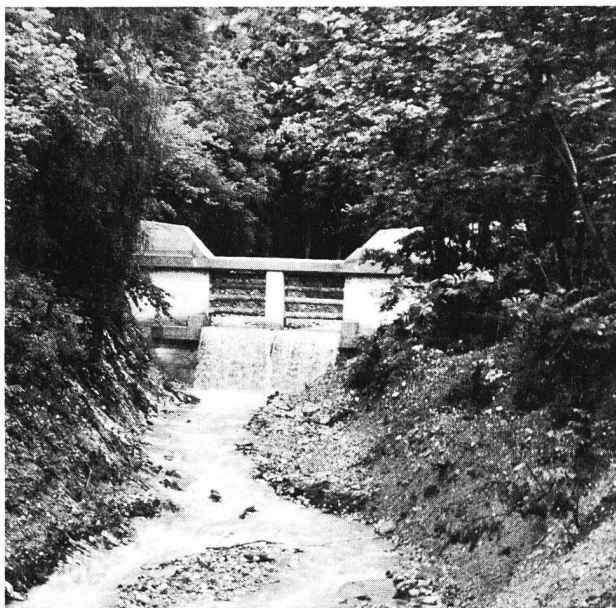
Figura 3. Sbarramento aperto con montante intermedio e travi orizzontali. Colata di fango presso Trimmis, Cantone Grigioni.

zone larghe, calme dove il pesce trova un ambiente a lui congeniale.