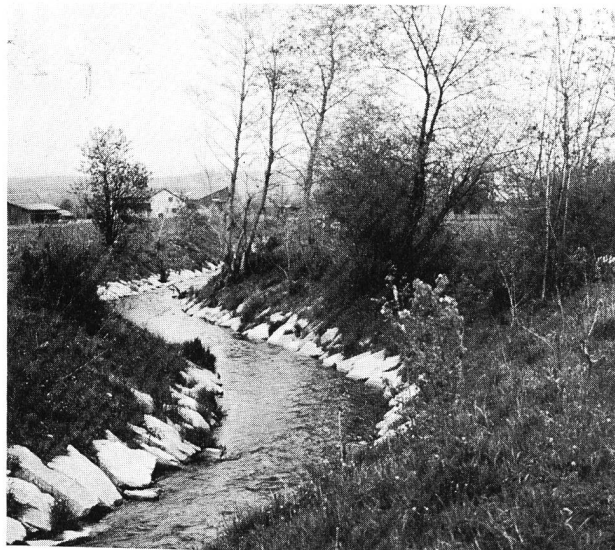
Figura 4. Lavori di correzione del ruscello Uerke presso Köllichen, Cantone Argovia (profilo trasverso = 30 m 3 /s).

I costi relativi ad un miglioramento che la correzione apporta allo stato primitivo saranno da ripartire in base ai vantaggi che risultano per i vari interessati.