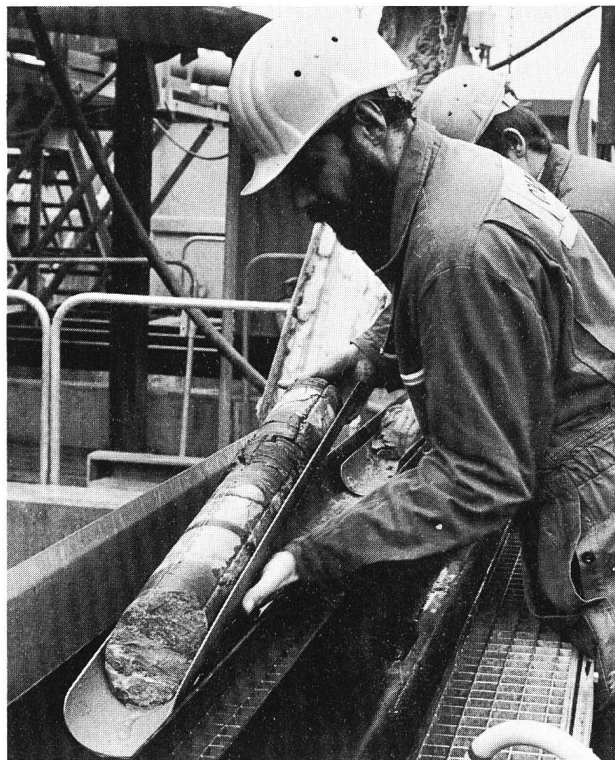
Auf der Nagra-Bohrstelle Weiach (ZH) wurden die Teilnehmer an der Exkursion des Linth-Limmatverbandes Zeugen eines aufsehenerregenden Fundes: Als erste Aussenstehende bekamen sie Bohrkerne zu Gesicht, die auf ein Kohlevorkommen in rund 1600 Meter Tiefe schliessen lassen.

Der Besuch der Tiefbohrung in Weiach beeindruckte die Teilnehmer: Ein mustergültig organisierter, sauberer Bauplatz, auf dem in der Mitte der 46 m hohe Bohrturm steht. Ruhige, zielgerichtete Arbeit ermöglicht es aus dem Untergrund bis auf 2000 m Tiefe Gesteinsproben heraufzuholen. Um aus dem «Nadelstich» ins Erdinnere, möglichst viel an Auskünften und Wissen herauszuholen, werden