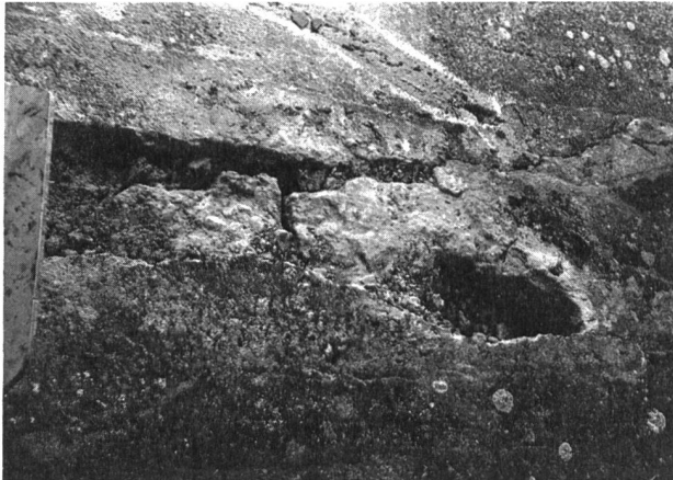
Bild 5. Ein grösserer Schaden an einer Böschungsplatte.

beschädigte Beton ganz entfernt und neu aufgebracht. Dabei wird, wenn notwendig, Armierung eingelegt.