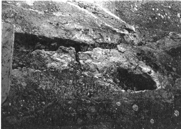
Bild 5. Ein grösserer Schaden an einer Böschungsplatte.

beschädigte Beton ganz entfernt und neu aufgebracht. Dabei wird, wenn notwendig, Armierung eingelegt.