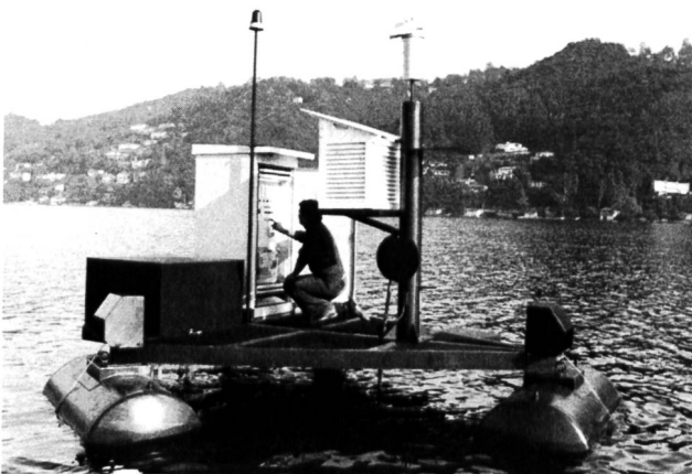
Die automatische schwimmende Messstation auf dem Luganersee.

Eine schwimmende Messstation zur kontinuierlichen Messung und Aufzeichnung der Wasser- und Luftigenschaften ist seit Oktober 1975 auf dem Luganersee in Betrieb. Die Messstation wurde im Rahmen eines Programmes zur Erforschung des Luganersees für die biologische Abteilung des CCR Euratom von Ispra entwickelt. Mit ihrer Hilfe sollen in den nächsten Jahren genaue Informationen über die physikalisch-chemischen Eigenschaften des Wassers in der Bucht von Agno gesammelt werden. Dort wird die sich zur Zeit im Bau befindliche Kläranlage der Stadt Lugano ihre Abwasser einleiten und somit möglicherweise starke Veränderungen der ökologischen Verhältnisse hervorrufen.