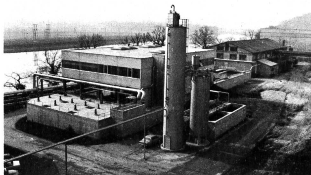
Bild 5 Die mechanisch-chemische Abwasserreinigungsanlage MEKA.

Natürlich konnten auch beim Kanton die finanziellen Folgen der Gewässerschutzforderungen nicht unbeachtet bleiben. Neben der Möglichkeit steuerlicher Begünstigungen für die Abwasseranlagen schuf er 1970 als Novum die Gewährung von unverzinslichen Darlehen an die Industrien, sofern ihr durch die Abwassersanierung besonders schwere Belastungen entstünden. Von dieser Möglichkeit konnte auch Attisholz Gebrauch machen. Nachdem Attisholz der einzige verbliebene Produzent von Zellstoff in der Schweiz ist und mit der Alkoholablieferung und der Holzverwertung aus der Forstwirtschaft weitere landeswichtige Interessen erfüllt, dürfte auch vom Bund ein angemessenes finanzielles Engagement erwartet werden.