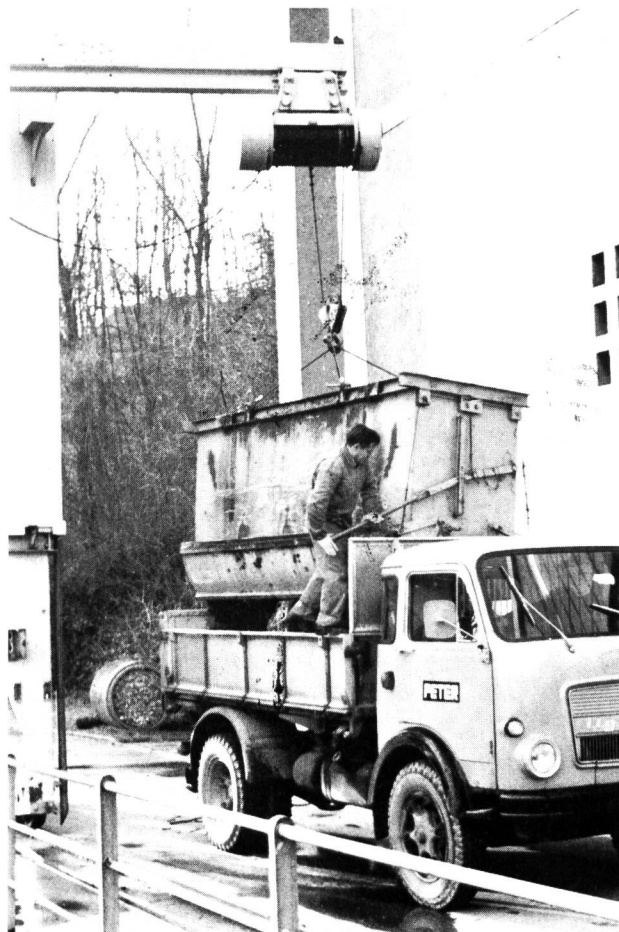
Bild 11 Kraftwerk Rheinau: Entleerung der Rechengut-Mulde auf Lastwagen.

gen kann, ist die Schaffung von Rückhaltebecken mit Fassungsvermögen von einigen hundert Kubikmetern und Plätzen für Zwischendeponien unerlässlich.