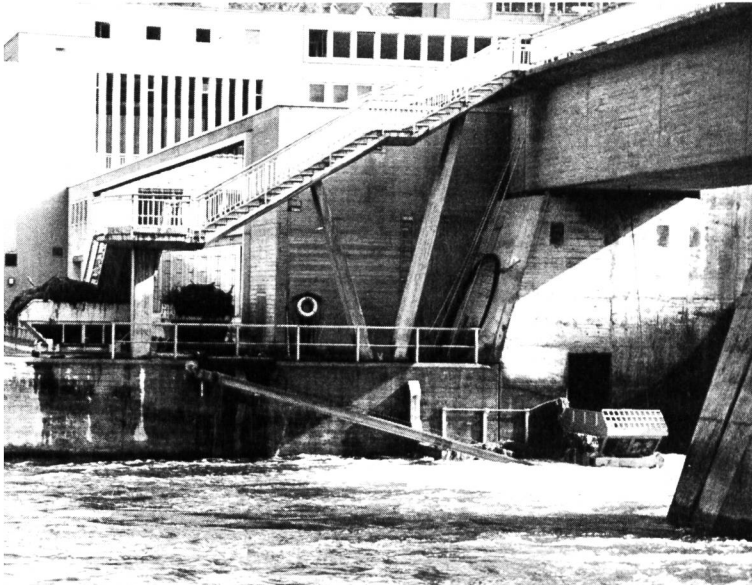
Bild 8 Kraftwerk Schaffhausen: Vor dem Auslauf der Geschwemmselrinne ist eine Welakimulde installiert, in der das Rechengut zurückgehalten wird; auf der Plattform vor der Zentrale stehen zwei gefüllte Mulden bereit zum Abtransport.