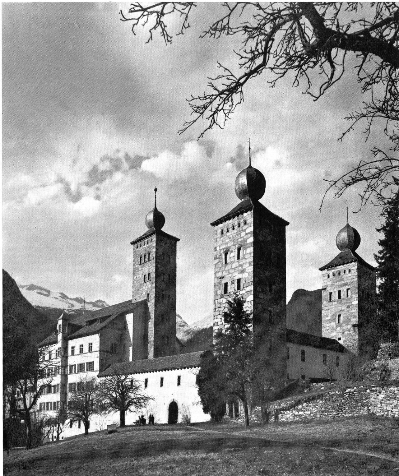
Der imposante, aus dem 17. Jahrhundert stammende Stockalperpalast in Brig, in welchem die Hauptversammlung zur Durchführung gelangt.

SCHWEIZERISCHER WASSERWIRTSCHAFTSVERBAND