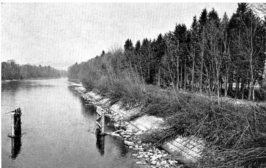
Bild B Begradigter Lauf der Reuss bei Werd-Rottenschwil. Die Verbauungen stammen noch aus dem letzten Jahrhundert. Die standortsfremden Fichtenpflanzungen des Uferwaldes stehen mit der den Gemeinden ehemals auferlegten Wuhrpflicht in Zusammenhang.