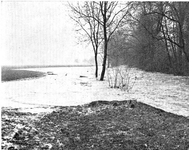
Bild 2 Ueberschwemmung in der Gemeinde Brittnau.

schnitt. Um durch die grösseren Wassergeschwindigkeiten das Gerinne nicht zu beschädigen, müssen die Ufer bis auf 1,50 m ab Sohle mit Steinblöcken gesichert werden. Die Sohle muss durch Schwellen aus Rundholz bzw. Beton und mittels einer Sohlenabsicherung aus gebrochenen Steinen fixiert werden. Dank der Sohlenabsenkung und dem erhöhten Längsgefälle kann der maximale Hochwasserabfluss durchgehend 60 bis 80 cm unter dem angrenzenden Gelände gehalten werden. Es ist somit eine sichere Entwässerung des Umgeländes zu jeder Zeit gewährleistet. Ebenso können durch diese Massnahmen die noch vorhandenen Wassermatten in der Gemeinde Brittnau erhalten bleiben.