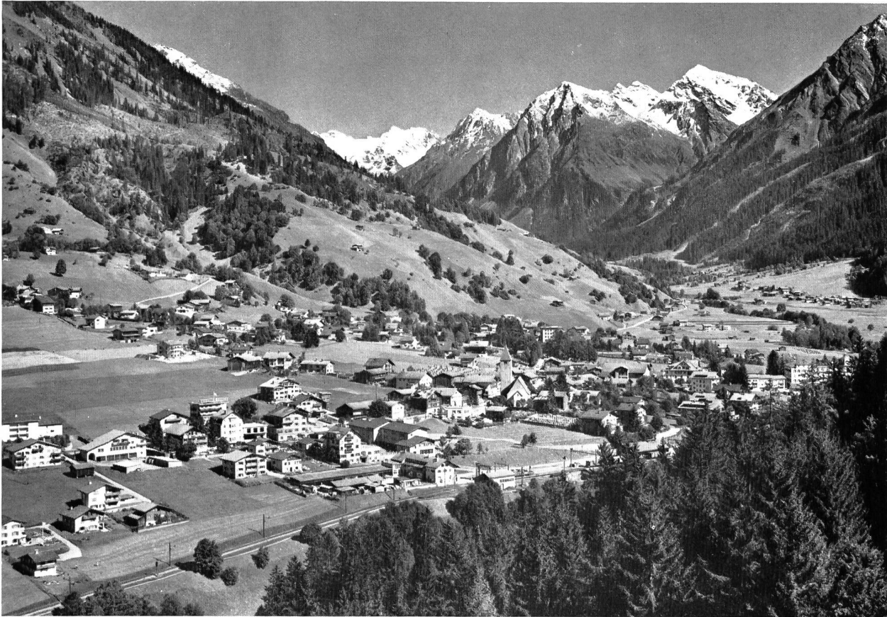
Die stattliche Ortschaft Klosters im Prättigau; Tagungsort der diesjährigen Hauptversammlung SWV; im Hintergrund die Bergkette der Silvretta-Gruppe.