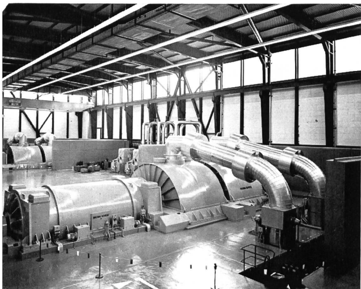
Bild 2 Maschinenhaus des Kernkraftwerks Mühleberg mit den zwei Turbogeneratorengruppen.