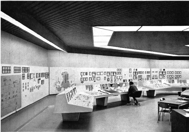
Bild 3 Kommandoraum des Kernkraftwerks Mühleberg.

gemäss und nicht fundiert. Vergessen wir nicht, dass vor etwas mehr als 100 Jahren die Schweiz noch wirtschaftlich schlecht dastand und nicht alle ihre Kinder ernähren konnte; sie exportierte sie in fremde Dienste. Die Schweiz hatte damals die Probleme, die sich heute den unterentwickelten Ländern stellen. Tausende von Kindern zwischen 9 bis 12 Jahren arbeiteten täglich während 14 Stunden in Werkstätten und wurden nicht zur Schule geschickt. Man brandmarkte die Landstreicher und Bettler, um die Städte von ihnen freizuhalten. Es sind der industrielle Fortschritt und die geregelte Arbeit, die mit Hilfe der Elektrizität aus der Schweiz im Zeitraum von vier Generationen eines der fünf reichsten Länder der Welt gemacht haben. Unsere Gesellschaft ist in einem enormen Fortschritt begriffen. Sie hat eine wahre Lebenskunst entwickelt. So ermöglicht sie die Entwicklung und Differenzierung der Persönlichkeit: sie befriedigt bereits mehr Wünsche nach kulturellen Gehalten als materielle Bedürfnisse. Sie stellt eine unentbehrliche Stufe in der menschlichen Entwicklung dar. Man soll sie verstehen und benützen zur