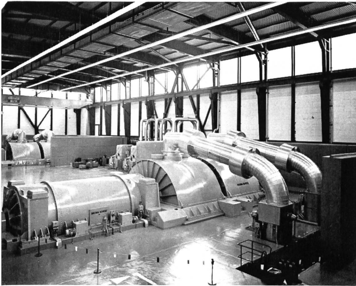
Bild 2 Maschinenhaus des Kernkraftwerks Mühleberg mit den zwei Turbogeneratorengruppen.