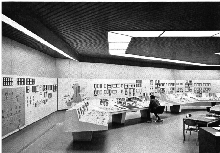
Bild 3 Kommandoraum des Kernkraftwerks Mühleberg.

gemäss und nicht fundiert. Vergessen wir nicht, dass vor etwas mehr als 100 Jahren die Schweiz noch wirtschaftlich schlecht dastand und nicht alle ihre Kinder ernähren konnte; sie exportierte sie in fremde Dienste. Die Schweiz hatte damals die Probleme, die sich heute den unterentwickelten Ländern stellen. Tausende von Kindern zwischen 9 bis 12 Jahren arbeiteten täglich während 14 Stunden in Werkstätten und wurden nicht zur Schule geschickt. Man brandmarkte die Landstreicher und Bettler, um die Städte von ihnen freizuhalten. Es sind der industrielle Fortschritt und die geregelte Arbeit, die mit Hilfe der Elektrizität aus der Schweiz im Zeitraum von vier Generationen eines der fünf reichsten Länder der Welt gemacht haben. Unsere Gesellschaft ist in einem enormen Fortschritt begriffen. Sie hat eine wahre Lebenskunst entwickelt. So ermöglicht sie die Entwicklung und Differenzierung der Persönlichkeit: sie befriedigt bereits mehr Wünsche nach kulturellen Gehalten als materielle Bedürfnisse. Sie stellt eine unentbehrliche Stufe in der menschlichen Entwicklung dar. Man soll sie verstehen und benützen zur