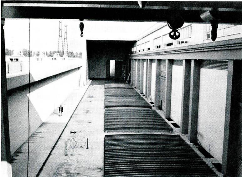
Bild 10 Abdachung der horizontalen Kaplan-turbinen (Rohrturbinen) beim Rheinkraftwerk Strassburg.

grossartigen Strassburger Münster geboten wird, währenddem die an den technischen Anlagen interessierten Exkursionsteilnehmer zum allerdings leider nur flüchtig möglichen Besuch des seit 1970/71 im Betrieb stehenden Rheinkraftwerks Strassburg der EdF und der zugehörigen Schiffsanlagen (Bilder 9, 10) fahren. Dieser Besuch ermöglicht es, sich ein gutes Bild auch des fertigen Kraftwerks Gamsheim zu