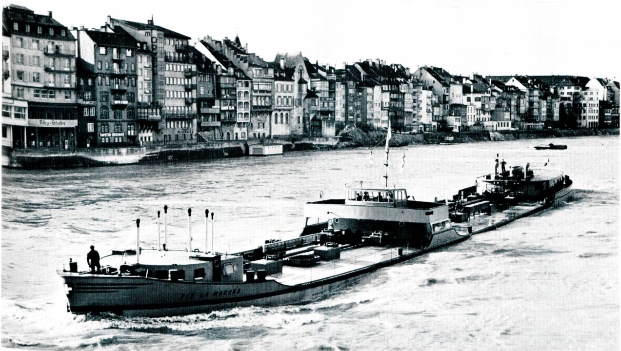
Bild 4 Die schweizerische Energieversorgung basiert heute zu vier Fünfteln auf Mineralöl. Die flüssigen Treib- und Brennstoffe werden zu einem runden Drittel auf dem Rhein eingeführt. — MTS Piz La Margna der BRAGTANK AG mit einer vollen Ladung von 1800 Tonnen.

Rheinhäfen beider Basel Anschluss an das westeuropäische Binnenwasserstrassennetz erhalten hat.