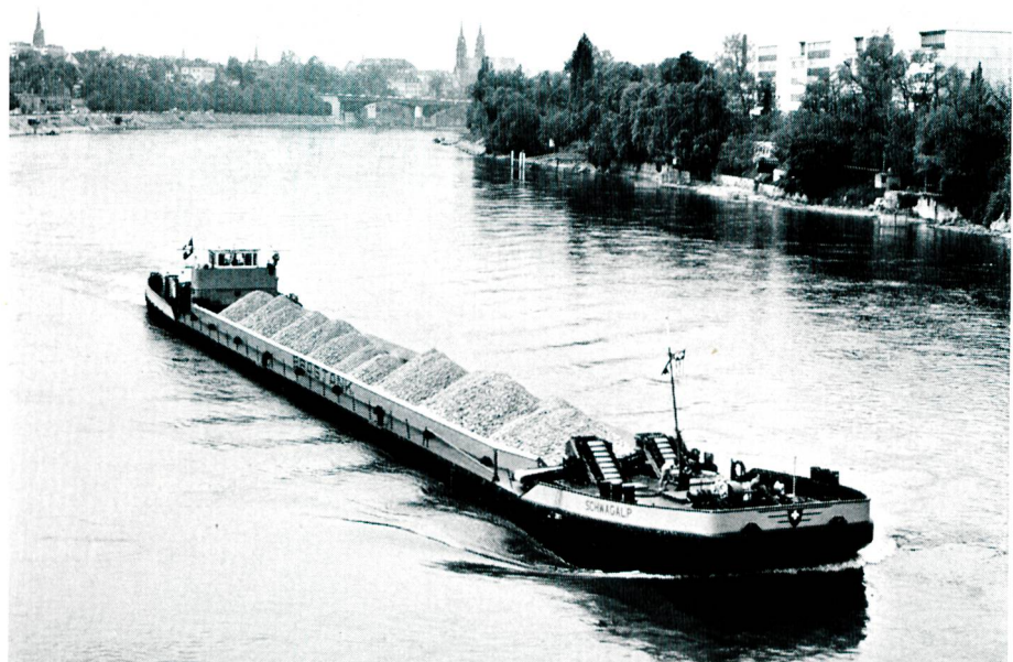
Bild 1 Baumaterialien sind heute das wichtigste Transportgut der Binnenschifffahrt. MS Schwägalp, neuestes, selbstlöschendes Kiesschiff der BRAGTANK AG mit einer Ladung von 1500 Tonnen

Jedenfalls hat die Generation unserer Grossväter mit bewundernswürdigem Wagemut die Schweiz verkehrsmässig durch ein dichtes Eisenbahnnetz erschlossen, und selbst vor dem grosszügigen Alpendurchstich am Gotthard