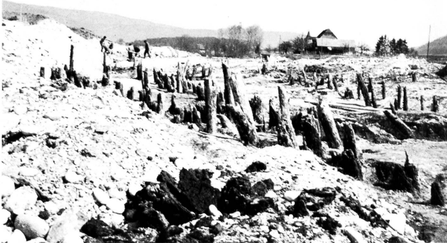
Bild 10 Uferverbauung an der Zihl aus dem 16. Jahrhundert; im Hintergrund das Fanel- schlösschen

dieser Zeitepoche. Die beiden Häuser sind mit grösster Wahrscheinlichkeit die Vorläufer des heute noch erhaltenen Fanel Schlösschens, das im 17. Jh. auf der höchsten Stelle des rechten Zihlufers zwischen Neuenburgersee und Zihlbrücke erbaut worden war. Ofenkacheln und Keramik, die in der Umgebung der Hausfundamente und der Ufersicherung zum Vorschein kamen, ermöglichten deren Datierung.