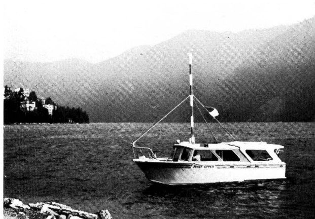
Das Vermessungsboot «Josef Epper» des Eidg. Amtes für Wasserwirtschaft im Einsatz auf dem Luganersee

An der Aare im Dählhölzli zeigte Sektionschef A. H a g m a n n