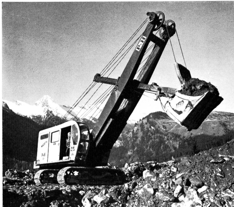
Bild 1 Seilbagger P&H Harnischfeger.

und in ihrer Konzeption absolut neuartigen Belagsfabrik in Holland beiwohnte, die durch Ammann geliefert worden ist. Es lässt aufhorchen, wenn in einem Exportland trotz EWG noch heute mehr als drei Viertel aller arbeitenden Aufbereitungsanlagen