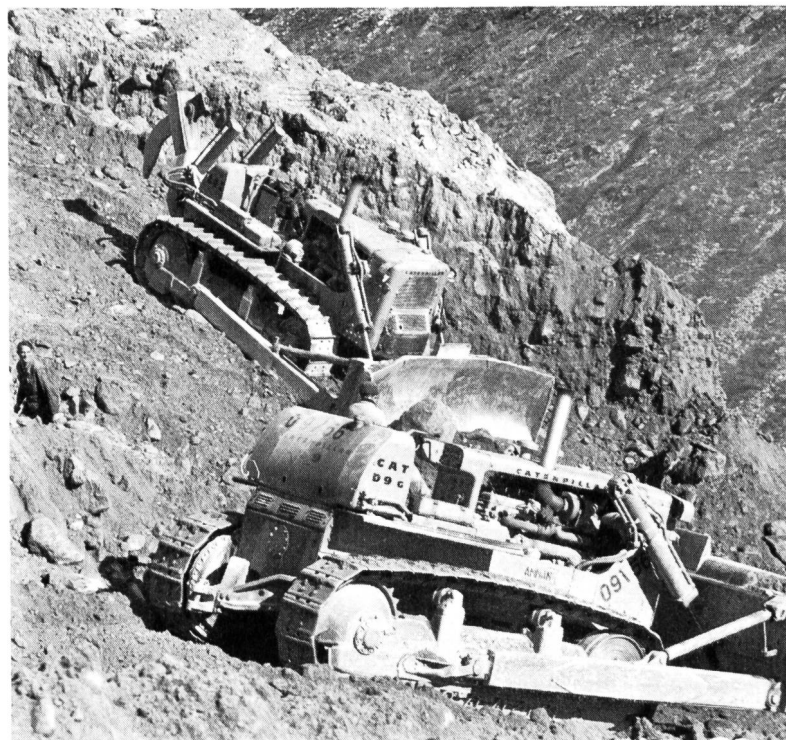
Bild 2 CAT Bulldozers