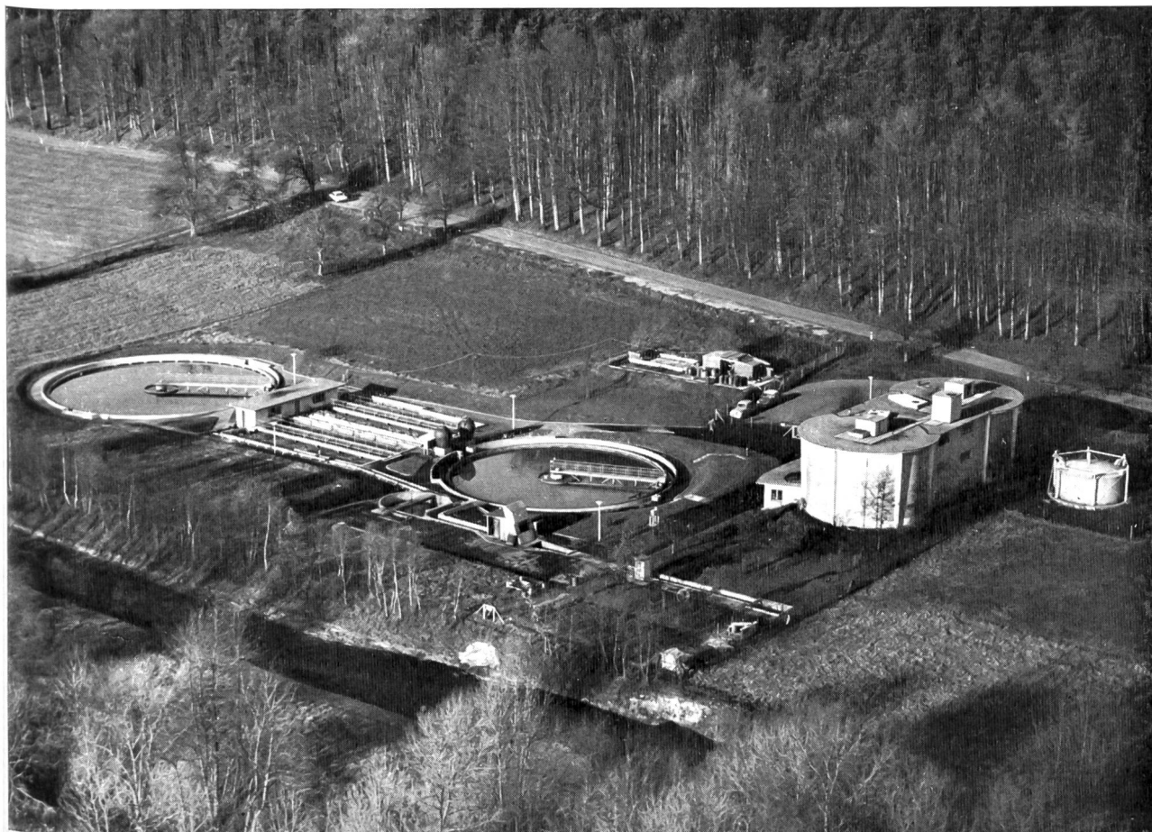
Kläranlage Uster (Kanton Zürich), eine der ersten Anlagen, welche die dritte Reinigungsstufe einführt. Erste Betriebsaufnahme 1956 mit mechanisch-biologischer Reinigung, seit 1960 Phosphatfällung nach dem Simultanverfahren. Flugbild Nov. 1963 Baudirektion Kanton Zürich

Das vorläufig auf freiwilliger Basis befriedigend gelöste Detergentienproblem bedarf im Rahmen der in Vorbereitung stehenden Revision des eidg. Gewässerschutzgesetzes der verbindlichen rechtlichen Regelung.