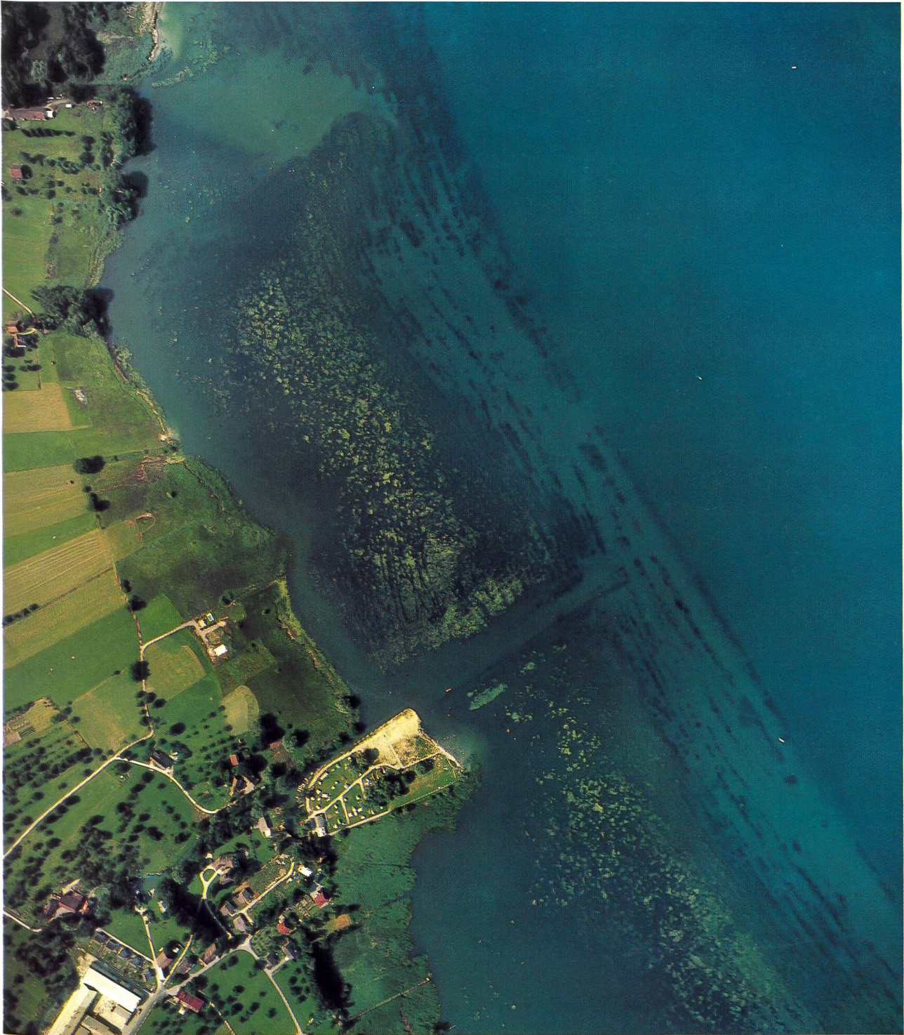
Bucht Romanshorn bis Luxburg mit den Zuflüssen Salmsacheraach (oben) und Luxburgeraach (unten). Die stark verunreinigte Uferzone ist fast ausschliesslich vom kammförmigen Laichkraut ( potamogetum tectinatus ) bewachsen (dunkelgrün), das im Bereiche der Seeoberfläche zunehmend von verschiedenen Algen überwachsen wird (gelbgrüne Algenteppiche).