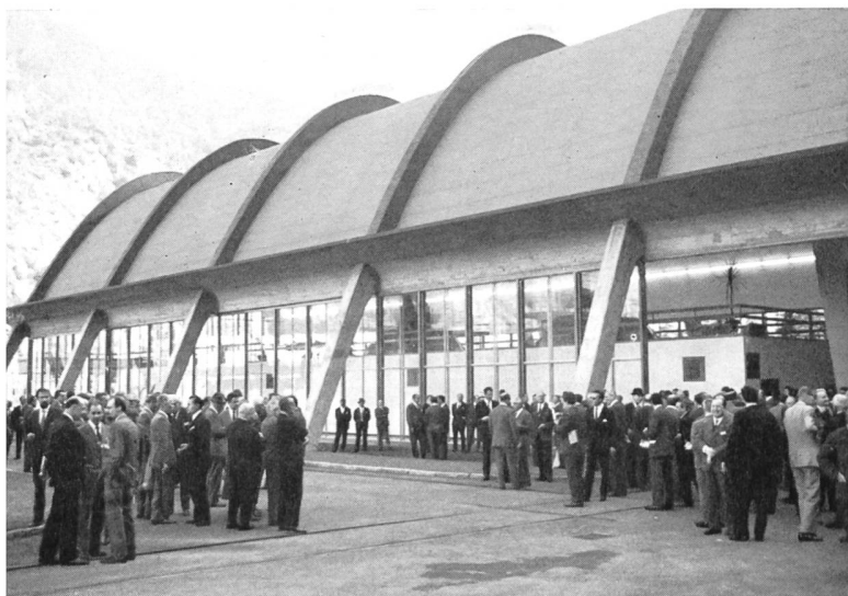
Bild 2 Eine grosse Teilnehmerschar besammelt sich zur Einweihung des neuen Kraftwerks der AET.