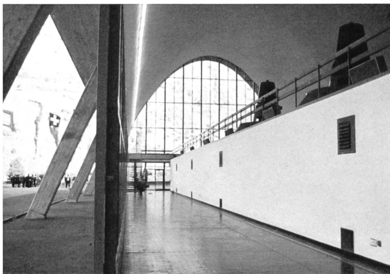
Bilder 3 und 4 Innenansichten der aussergewöhnlich elegant konzipierten Zentrale Nuova Biaschina.