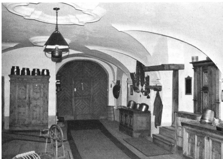
Bild 3 Engadiner Sulër im Haus Pianto in Samedan.