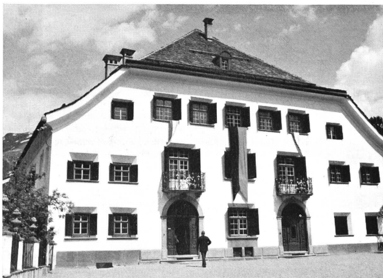
Bild 2 Chesa Planta, typisches Engadiner Patrizierhaus in Samedan, in welchem u.a. die romanische Bibliothek untergebracht ist.