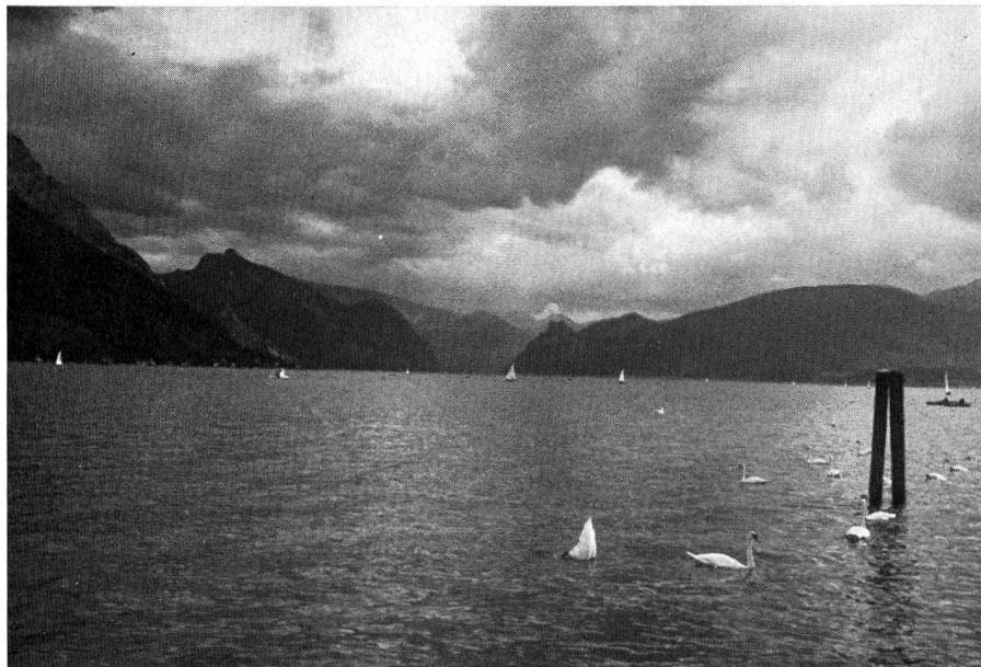
Bild 7 Düstere Stimmung am Traunsee.

Das nächste, 13. Symposium der FEG ist dem Thema «Schutz der Küstengewässer» gewidmet und soll im Sommer 1967, verbunden mit einer Fahrt nach Helgoland, in Hamburg zur Durchführung gelangen.