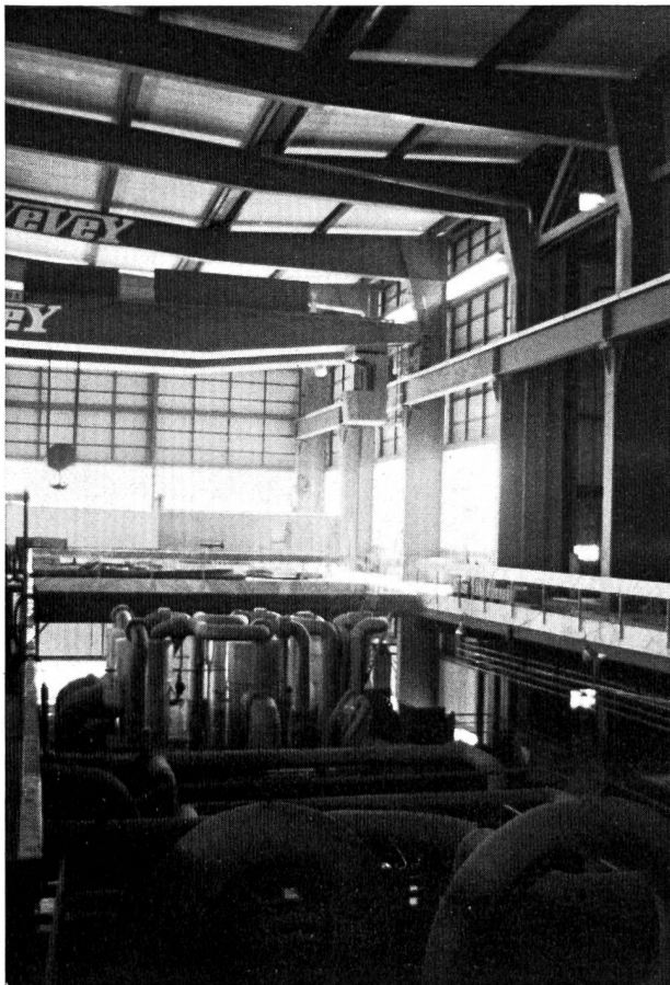
Bild 4 Innere Teilansicht des Kraftwerks Vouvry.