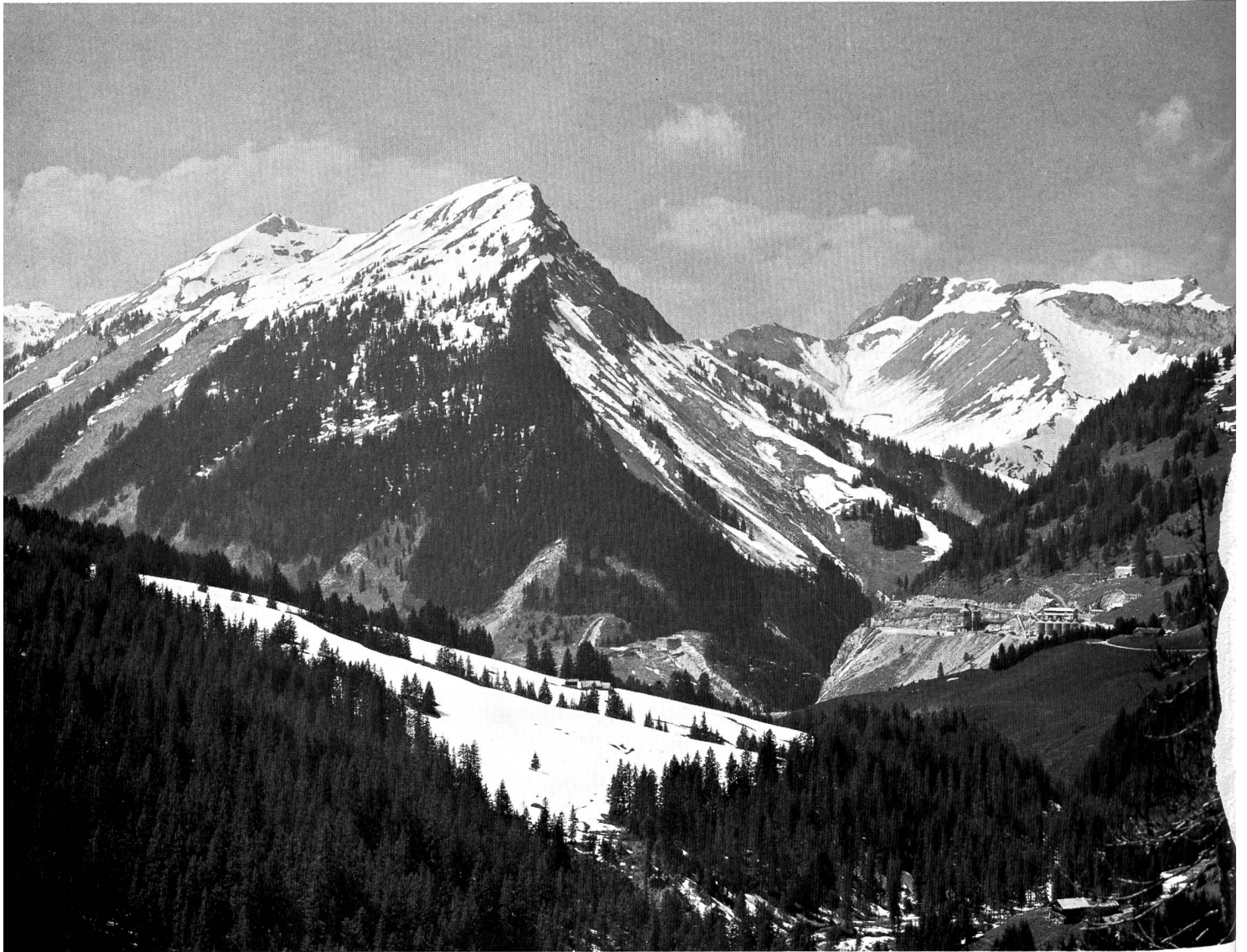
Vue générale du Tabouset; à droite au fond les installations pour les barrages de l'Hongrin