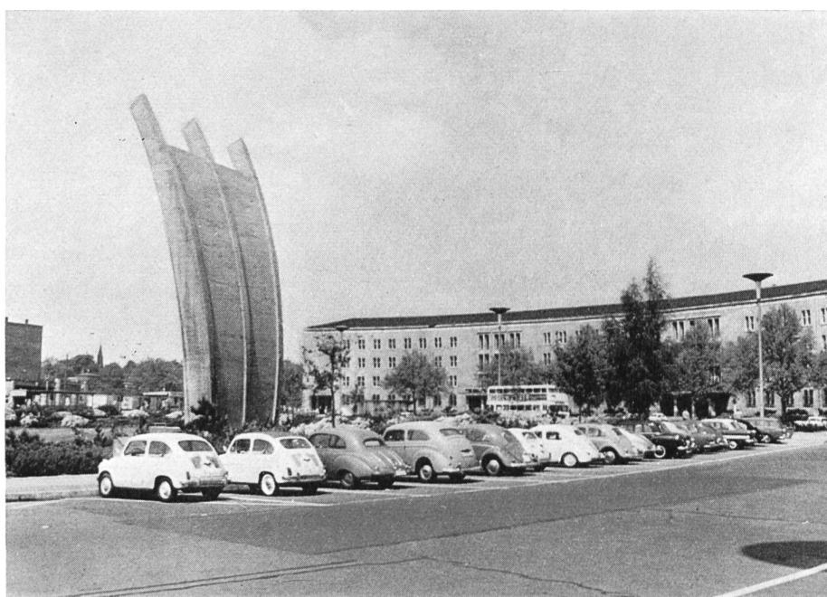
Fig. 1 Luftbrücken-Denkmal beim Flughafen Tempelhof in West-Berlin

Vor dem eigentlichen Kongress fand vom 20. bis 22. Mai 1963, ebenfalls in Berlin, die traditionelle Jahrestagung des deutschen Gas- und Wasserfaches statt, umfassend Mitgliederversammlungen, Vortragsveranstaltungen über aktuelle Themen der Gas- und Wasserversorgungstechnik einschliesslich rechtliche und wirtschaftliche Fragen, sowie eine Reihe von Besichtigungen, die den Teilnehmern die neuzeitlichen Anlagen und Einrichtungen der Berliner Gaswerke und der Stadtentwässerung zeigten; darüber hinaus wurden auch bekannte Berliner Industriebetriebe besucht.