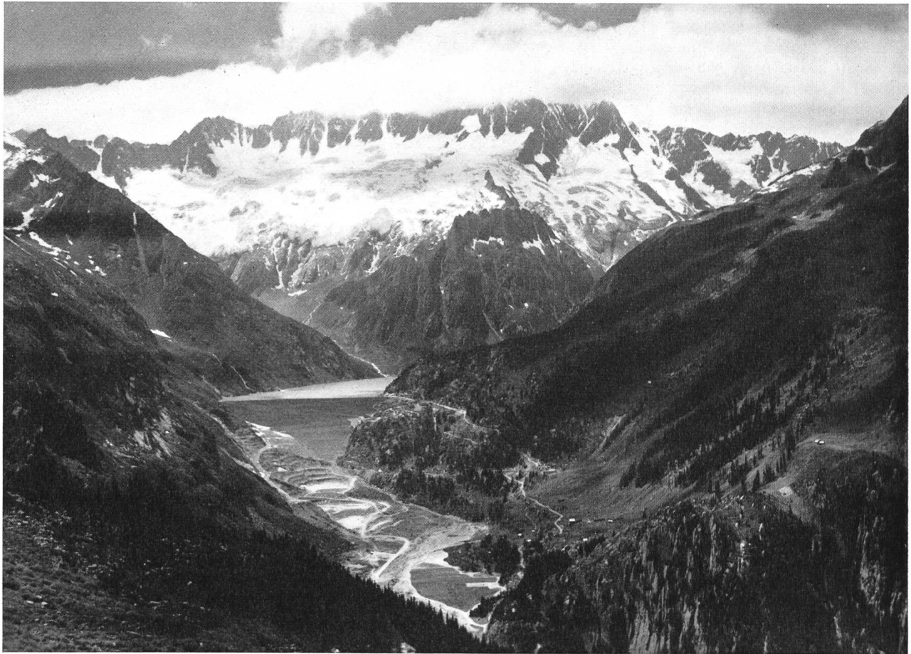
Fig. 2 Blick auf Staudamm und Stausee Göschenentalp mit Dammagruppe im Hintergrund

im Hintergrund grüsste die an den Winter mahnende frisch verschneite Bergkette des Dammastockes. Nach einer markanten und von bemerkenswerten technischen Kenntnissen zeugenden kurzen Ansprache segnete sodann Bischof J. Vonderach den Damm ein. Im geräumigen Bergrestaurant Dammastock, wo der Apéritif offeriert wurde, genoss man einen prächtigen Blick bergwärts auf den begrünten Dammkörper; talwärts erblickte man im Gwüest die schmucken Heimwesen, wo die umgesiedelte Bevölkerung eine neue Heimstätte gefunden hat, nachdem der Weiler auf Göschenentalp dem Stausee geopfert werden musste, sowie das wieder erstandene Kirchlein mit dem prächtigen Altar.