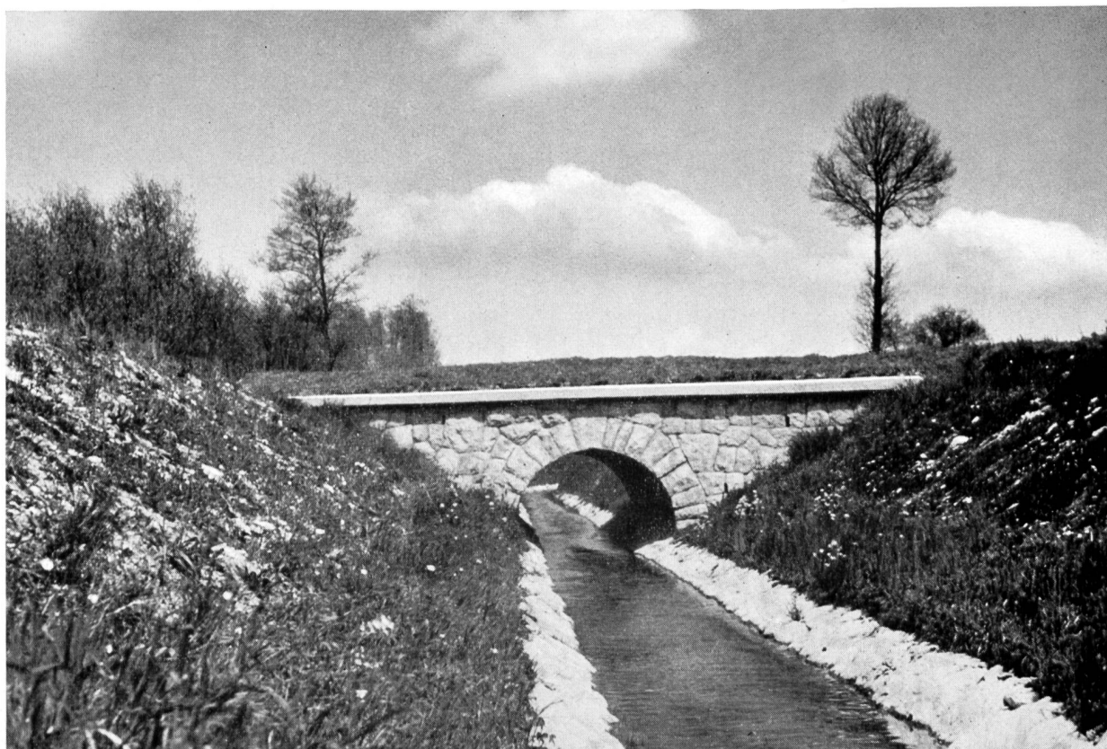
Bild 2 Ausgebauter Vorflut-Kanal

Noch einige allgemeine Hinweise auf die bei der Anordnung der Sammelleitungen von Entwässerungen zu befolgenden Grundsätze. Es ist hier vor allem auf