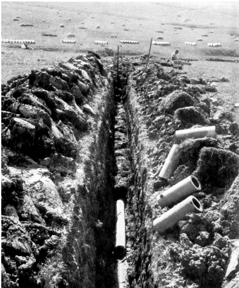
Bild 3 Drainagegraben im Bau

Es soll hier einmal auf die oft gehörten Befürchtungen eingetreten werden, wonach die großflächigen Entwässerungen mancher Talgebiete dazu führen sollten, daß die Hochwasserspitzen der talabwärts gelegenen Wasserläufe viel ausgeprägter würden. Der durch die Entwässerungen bewirkte raschere Abfluß stärkerer Niederschlagsmengen scheint, oberflächlich betrachtet, ja durchaus zu größeren Flutwellen der Wasserläufe führen zu müssen. In der Wirklichkeit sehen die Dinge aber etwas anders aus, und man muß jedenfalls vor Verallgemeinerungen einzelner Beispiele auf der Hut sein. Die Wasseraufnahme und damit die Retentionskapazität des Bodens versumpfter Gebiete ist nämlich in jedem Fall kleiner als diejenige drainierter Flächen. Entscheidend ist aber das Bestehen zahlreicher Geländedepressionen wie Torfstiche oder im allgemeinen trocken liegender abflußloser Altwasserläufe, in die sich bei großen Niederschlägen ein namhafter Teil der Flutmenge ergießen kann. Dabei werden im weiter unten gelegenen Talabschnitt die Hochwasserdurchflüsse stark abgeschwächt.