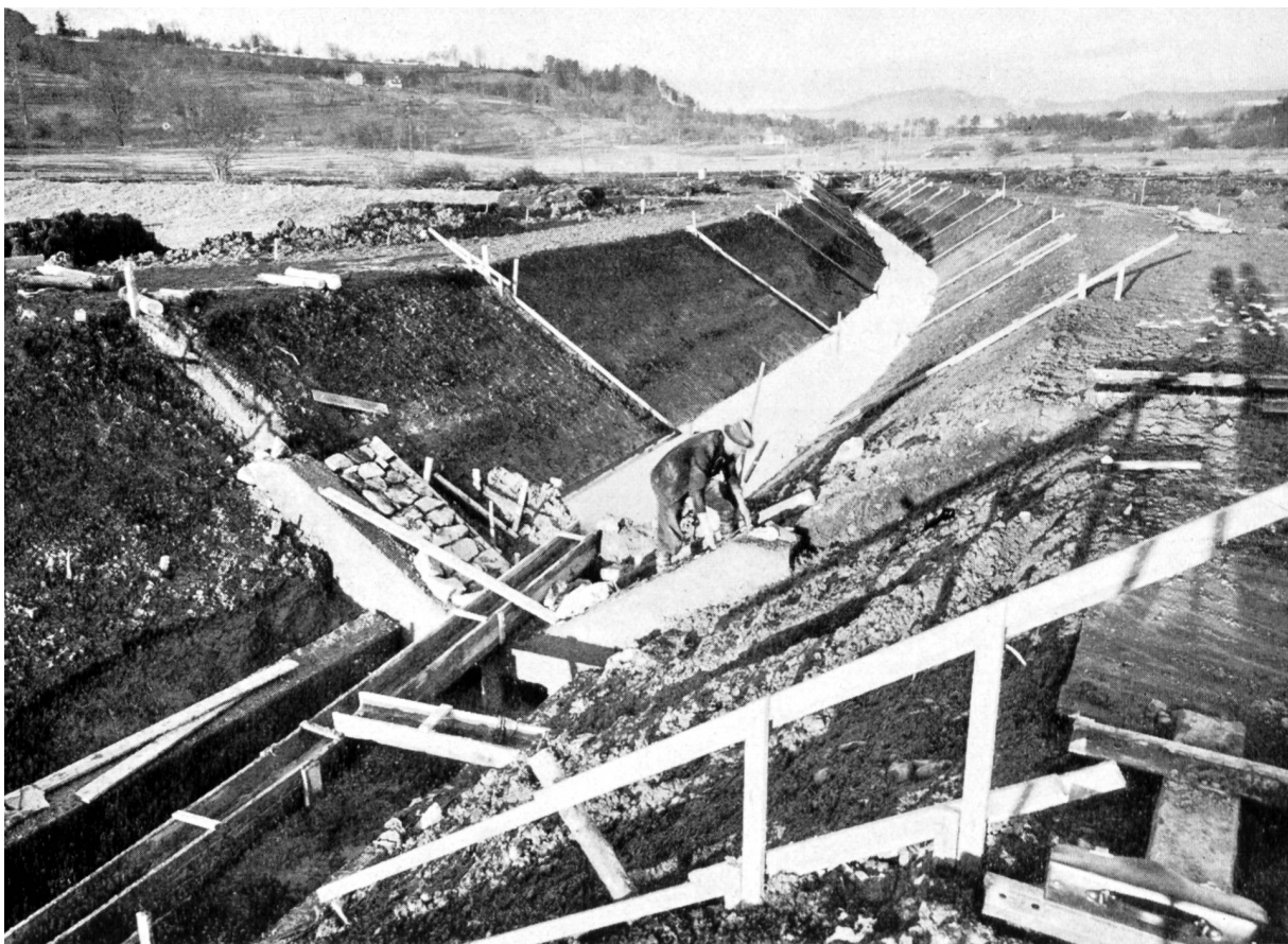
Bild 1 Vorflut-Kanal im Bau

von den Hochwässern im Überschwemmungsbereich der Flußläufe abgelagerten, verhältnismäßig geringmächtigen Sandschichten. Für die Durchlässigkeit der für die Ernährung der Nutzpflanzen in Frage kommenden obersten Bodenschicht von höchstens 0,80 bis 1,50 m ist diejenige des kompaktesten Streifens ausschlaggebend, wobei sich infolge des ständigen Wechsels in der Bodenzusammensetzung sehr starke Schwankungen im Wasseraufnahme- und -durchlaßvermögen ergeben. Oft wechselt dieses innerhalb weniger Meter in einem Ausmaß, das eine Verdoppelung oder Verdreifachung der theoretisch erforderlichen Draindistanzen zulassen würde.