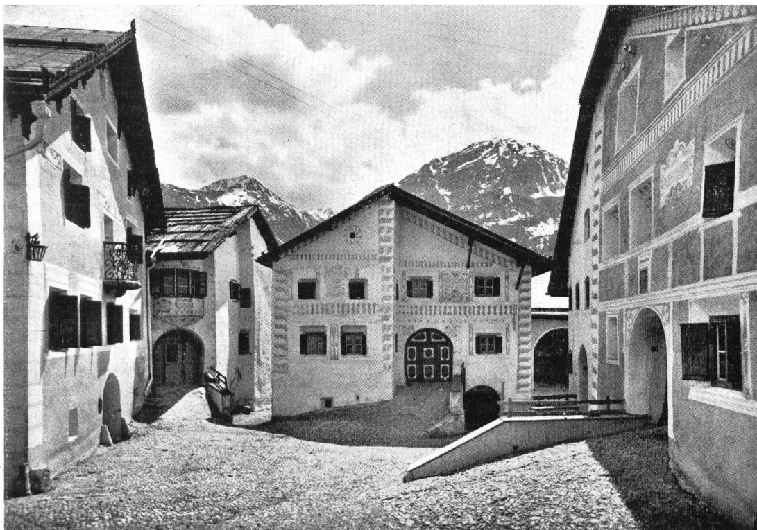
Dorfpartie mit typischen Engadinerhäusern in Guarda im Unterengadin.