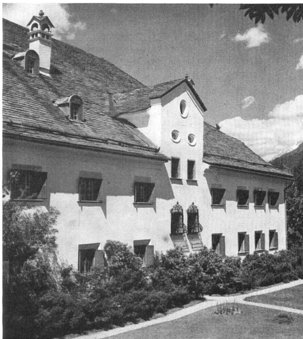
Plantahaus Samedan, heute Hort der rätoromanischen Bibliothek

von Tirol zu erwehren, die ihre dort erworbenen Rechte auszudehnen suchten. Als dann der Churer Bischof Peter von Böhmen, ein Fremdling, gar seine Länder an Österreich zu verpfänden drohte, griffen die Gotteshausleute zur Selbstverteidigung. 1367 versammelten sich ihre Abgeordneten zu Zernez und später in Chur und zwangen dem fürstbischöflichen Oberherrn ihre Aufsicht über die bischöfliche Verwaltung und die bischöflichen Finanzen auf. Die Gerichtsgemeinden des Oberengadins und des Bergells siegelten das Dokument bereits mit eigenem Siegel. Dasjenige des Oberengadins trägt wie heute noch das Bild des St. Luzius, des legendären königlichen Sendboten aus Britannien, der Rätien christianisiert haben soll.