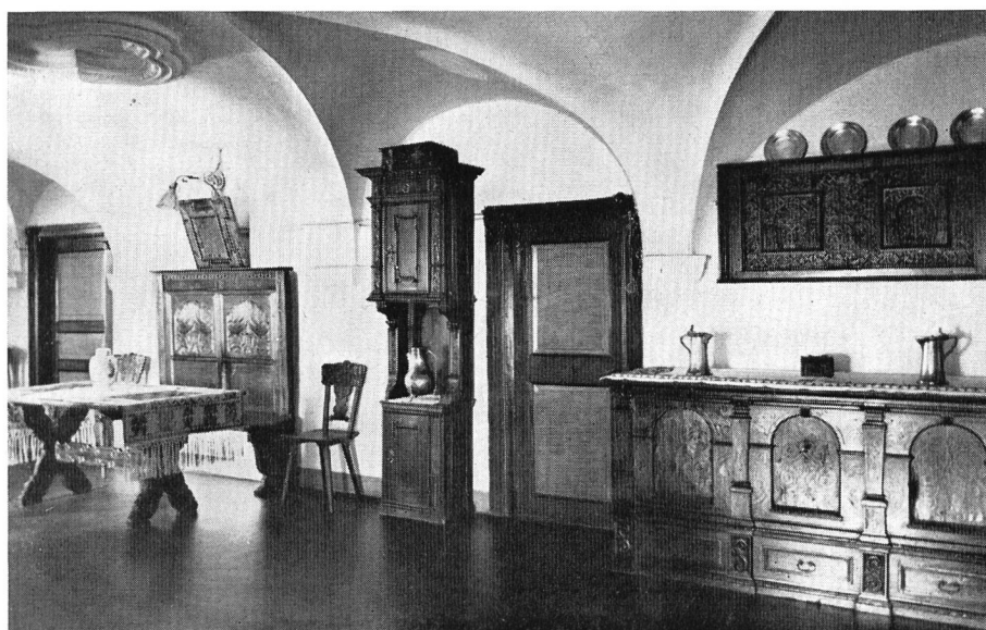
Wohndiele mit gediegener Möblierung in herrschaftlichem Engadinerhaus.