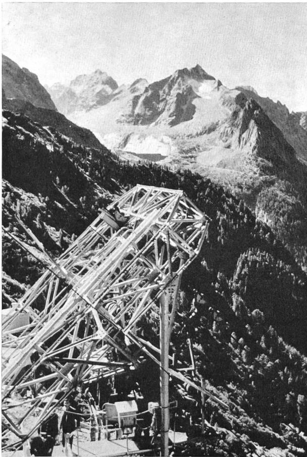
Bild 3 Baustelle Murtaira, Blick auf Scioragruppe und Piz Cacciabella, an dessen Fuß die Stauwehr Albigna

und 1957; in der Bausaison 1957 wurde die Abdichtung des Felsuntergrundes durch Injektionen ausgeführt, und es konnten 30 000 m 3 Beton im Probetrieb eingebracht werden; zudem wurde außerhalb des Stauraums ein Kies-Sand-Depot von etwa 400 000 m 3 angelegt. In der Bausaison 1958 erfolgten die Fertigstellung des Fundamentaushubs und die Weiterführung der Felsinjektionen. Der Betonierbetrieb konnte anfangs Mai aufgenommen werden, und es wurden eingebracht: etwa 40 000 m 3 im Mai, etwa 80 000 m 3 im Juni sowie je etwa 100 000 m 3 im Juli und August. Bis Mitte September wurden etwa 420 000 m 3 Beton hergestellt; die höchste Tagesleistung betrug über 5000 m 3 . Das Bauprogramm sieht vor, in der Saison 1959 weitere 300 000 bis 400 000 m 3 Beton, dessen Einbau langsamer vor sich gehen wird, einzubringen und einen Teilstau vorzunehmen, um in der Saison 1960 die Mauer fertigzustellen und erstmals im Herbst den Vollstau (Nutzinhalt 67 Mio m 3 ) zu erreichen. Nach eingehender Besichtigung der verschiedenen Aufbereitungsanlagen und Stärkung durch einen Imbiß in der geräumigen Kantine fahren wir ungeschützt mit der Seilbahn bei eisigem Hagelschlag wieder zu Tale.