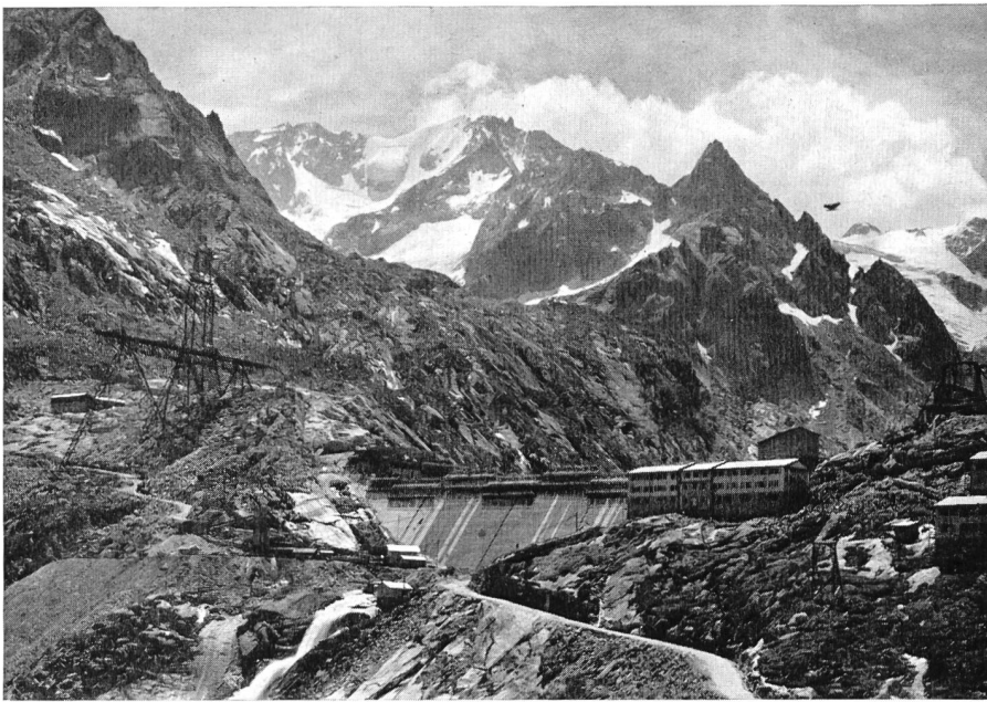
Bild 1 Staumauer Albigna; Blick auf Cima dal Cantun und Punta d'Albigna

mit je einem Druckbehälter, 2 atü Überdruck, System Hermanns; gleichzeitig werden vier Behälter durch Schwerkraft gefüllt (Fassung des Behälters 15 t, Bruttogewicht des Wagens etwa 23 t). Für den Zementtransport ins Bergell sind vier RhB-Zugspare — also täglich etwa 55 Wagen entsprechend gut 800 t — nötig, die zur Umschlag-Anlage in St. Moritz fahren. Unsere Fahrt von Landquart nach St. Moritz erfolgt in einer sehr originellen RhB-Zugskomposition: die neue Bo-Bo-Bo-Lokomotive, 2 Salonwagen, 2 Speisewagen und eine Anzahl Zementsilowagen!