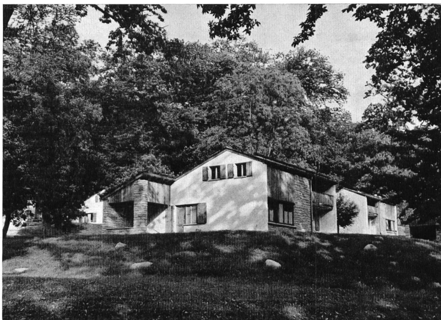
Bild 5 Die im prächtigen Kastanienwald ob Castasegna geschmackvoll angelegte Wohnsiedlung für das Kraftwerk-Personal

Auf der Rückfahrt wird die Gelegenheit geboten, die in Stampa kürzlich eingeweihte «Ciäsa granda» zu besuchen, das zu einem kleinen aber sehr sehenswerten Talmuseum gestaltete, aus dem 16. Jahrhundert stammende Patrizierhaus, wo wir freundlich empfangen und bewirtet werden.