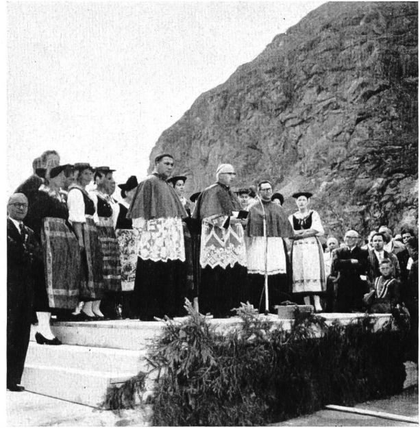
Bild 3 Einsegnungs-Zeremonie durch S. E. Mgr. Haller, Abt von Saint-Maurice; im Hintergrund Trachtengruppe der «Chanson Valaisanne»

ü. M.; das vom Corbassièreregletscher zugeführte Wasser stürzt in schönem, neugeschaffenem Wasserfall in den milchiggrauen langen Stausee von 180 Mio m 3 nutzbarem Stauinhalt; dieser entspricht einer gespeicherten Energie von rund 540 GWh. Mit 237 m größter Höhe stellt das imposante Sperrenbauwerk die höchste Bogenstaumauer der Welt — gegenwärtig, Irrtum vorbehalten, sogar die höchste Staumauer überhaupt — dar; wahrlich, ein bewundernswertes Zeugnis für den Wagemut und die Tatkraft schweizerischer Ingenieurkunst und kühnen Unternehmmergeistes.