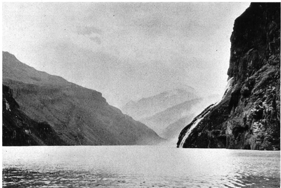
Bild 1 Der im Herbst 1958 erstmals gefüllte Stausee Mauvoisin, rechts Einleitung des vom Corbassière-Gletscher zugeführten Wassers