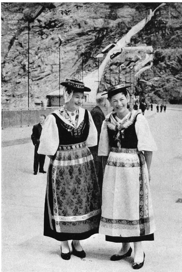
Bild 5 Zwei Walliserinnen anlässlich der Einweihung

September 1947 gegründeten Société des Forces Motrices de Mauvoisin S. A. , Sion, auch mit der Detailbearbeitung und der Bauleitung betraut 1 . Das Aktien-