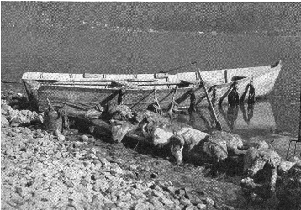
Abb. 1 Brienzersee, Beute einer Kontrollfahrt des Wasenmeisters von Brienz: 5 Kälber, 2 Schafe, 2 Katzen, 2 Füchse, 1 Reh, 1 Kaninchen, 3 Hühner

Die Abwasser der Gemeinden am untern Ende des Sees, linksufrig von der Kandermündung und rechtsufrig von Oberhofen an, sollen nicht mehr in den See geleitet werden, sondern mit Sammelleitungen der Gemeinschaftskläranlage der Region Thun zugeleitet werden. In dieser Reinigungsanlage sollen die Abwasser von Oberhofen, Hilterfingen, einem Teil von Spiez, Thun, Steffisburg, Heimberg, Thierachern und Uetendorf zusammengefaßt werden. (Abb. 2)