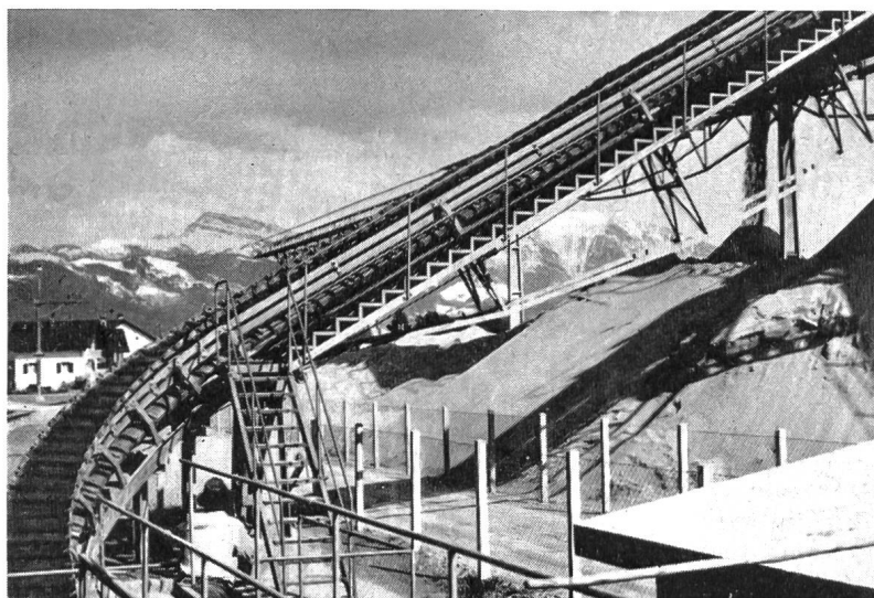
Abb. 2 Umladeanlage in Schmerikon am Zürichsee.