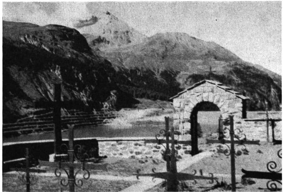
Abb. 2 Der kürzlich nach «Bardella» verlegte Friedhof Marmorera in seiner neuen Gestalt; Blick auf Stausee und Piz d'Arblatsch.

innerhalb eines einzigen Tages etwa 5 Mio m 3 Wasser zu mit einer Spitze von rund 90 m 3 /s, was für das Talbecken des Oberhalbsteins schon sehr hoch ist. Der große Zufluß wurde im Stausee zurückgehalten, dessen Spiegel im Verlauf von 24 Stunden um 5,2 m stieg. Dank diesem Rückhalt im Staubecken konnte das Oberhalbstein und dementsprechend auch das Domleschg vor Überschwemmungsschäden geschützt werden.