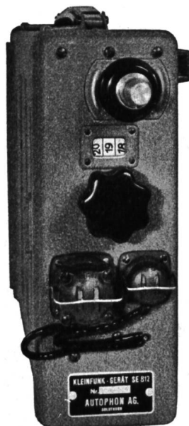
Links: Abb. 2, Gerät von oben. Konus mit Gewinde für die Antenne, Skala mit Drehknopf für die Kanalumschaltung, Schutzkappe auf der Steckdose der Sprechgarnitur, Blindstecker auf Steckdose der Fremdspeisung.

So ist für den fixen Einsatz des Kleinfunkgerätes ein Netzspeisegerät mit primärem Eingang für 110 bis 250 V Wechselstrom erhältlich. Die Leistungsaufnahme beträgt 40 bis 50 VA. Für Akkubetrieb, z. B. in Fahrzeugen, ist das Batterieanschlußgerät für 6, 12 oder 24 Volt gedacht. Dank kleinen Abmessungen von 385 \times 248 \times 128 mm läßt es sich z. B. beim Motorrad in der Satteltasche unterbringen.