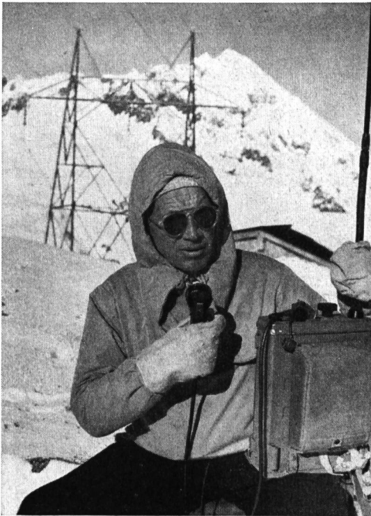
Abb. 4 Anwendung im Leitungsbau: Der Monteur steht in dauernder Sprechverbindung mit der Berghütte, von wo das Kraftwerk telephonisch erreichbar ist; so geht z. B. nach Beheben des Schadens die Meldung «Einschalten» vom abgelegenen Standort sofort zur Betriebsleitung.

Wenn kein Wechselstromnetz zur Verfügung steht und jeder Batterienachschub Schwierigkeiten bietet, ist der Handgenerator die ideale Ergänzung; die von diesem erzeugte Wechselspannung wird gleichgerichtet und geglättet über ein steckbares Verbindungskabel zugeführt.