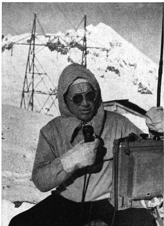
Abb. 4 Anwendung im Leitungsbau: Der Monteur steht in dauernder Sprechverbindung mit der Berghütte, von wo das Kraftwerk telephonisch erreichbar ist; so geht z. B. nach Beheben des Schadens die Meldung «Einschalten» vom abgelegenen Standort sofort zur Betriebsleitung.

Wenn kein Wechselstromnetz zur Verfügung steht und jeder Batterienachschub Schwierigkeiten bietet, ist der Handgenerator die ideale Ergänzung; die von diesem erzeugte Wechselspannung wird gleichgerichtet und geglättet über ein steckbares Verbindungskabel zugeführt.