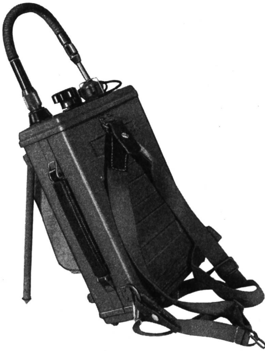
Abb. 1 Das Tornistertelephon «Autophon SE 812»

von mindestens 8 mVA am Hörer, gemessen bei einem Eingangssignal von 2,5 \mu\text{V} an der Antenne. Seine Empfindlichkeit ist 2,5 \mu\text{V} bei einem Rausch-Nutzspannungsverhältnis 1:3. Um empfangsseitig die atmosphärischen und industriellen Störungen zu unterdrücken, werden die hohen Sprachfrequenzen im Sender angehoben und beim Empfänger entsprechend reduziert. Eine spezielle Schaltung eliminiert weitgehend Störimpulse.