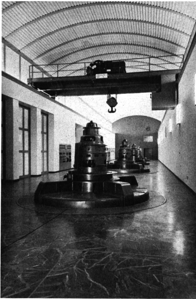
Abb. 3 Inneres der Zentrale Verbano mit vier Maschineneinheiten. Durch den schöngezeichneten grünen Marmorboden und die orangefarbenen Stirnwände wirkt der Kavernenraum sehr ansprechend.

auf Depot gelegt werden, weil die Kiessandgewinnungsstelle nachher überstaut wird.