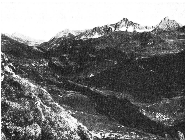
Abb. 3. Oberhalbstein, von Süden gesehen.

Sobald die seit 1947 durchgeführten, sehr umfangreichen Untersuchungen ergeben haben, daß bei Castiletto ein sicheres Abschlußbauwerk in wirtschaftlichen Grenzen erstellt werden kann, konnte das Projekt für das Kraftwerk Marmorera-Tinzen aufgestellt werden.