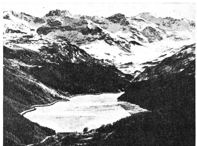
Abb. 4. Marmorera, Ansicht des Stausees gegen Süden.