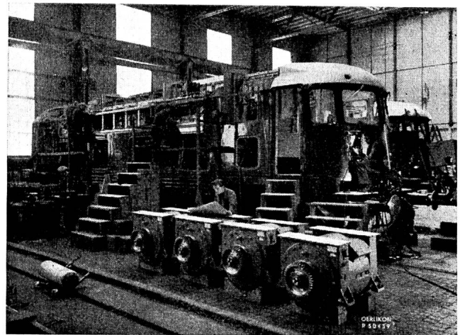
Fig. 16 Die Lokomotive in der Montagehalle. Im Vordergrund sieht man vier der acht Triebmotoren.

Diese Lokomotiven sind imstande, bei einer Fahrdrachtspannung von 1350 V die folgenden Züge dauernd auf ebener Strecke zu fördern: