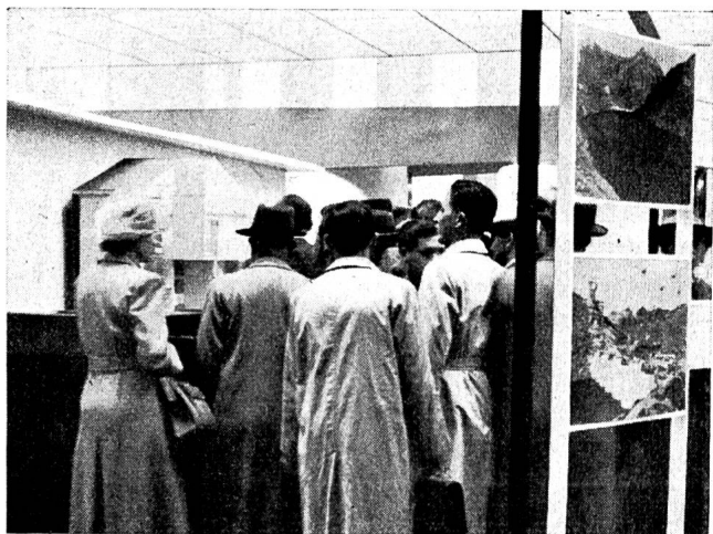
Fig. 13 Das Modell des Laufkraftwerks war stets umlagert.

Auf einer anderen Tafel wurde graphisch dargestellt, wie sich der Energieverbrauch auf die verschiedenen Ver-