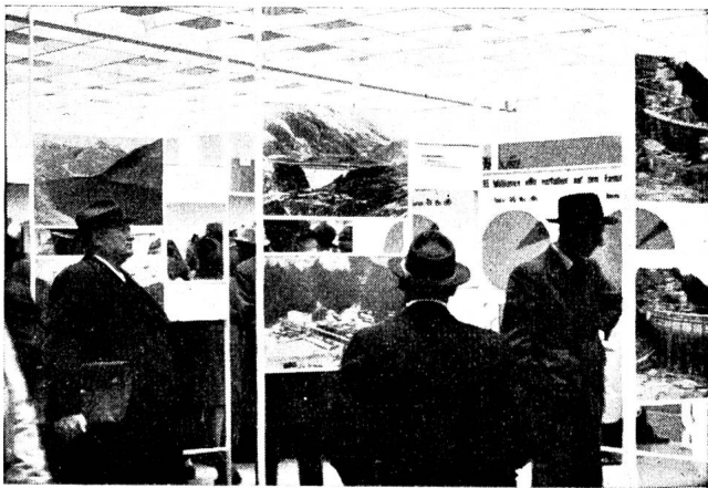
Fig. 12 Die Photos über die im Bau befindlichen Kraftwerke sowie die energiewirtschaftlichen Darstellungen wurden genau studiert.

besucher zu einem Modell eines Flusskraftwerkes, das in Betrieb war. Die aus Plexiglas erstellten Zu- und Ablaufkanäle dieses Modelles ermöglichten dem Beschauer, den Lauf des Wassers und den Antrieb einer Turbine beobachten zu können. Die Leitschaufeln dieses Modelles konnten von aussen geschlossen und geöffnet werden, was besonders attraktiv wirkte. Überhaupt bildete das Modell einen Anziehungspunkt des Standes; es war von morgens bis abends von Neugierigen aller Altersstufen beiderlei Geschlechts umstellt. Viele wünschten nähere Erklärungen, so dass immer jemand beim Modell stehen musste, um alle gestellten Fragen beantworten zu können. Das Modell ist vom Elektrizitätswerk Aarau ausgeführt und der «Elektrowirtschaft» für die Mustermesse zur Verfügung gestellt worden. Es sei dafür auch an dieser Stelle gedacht.