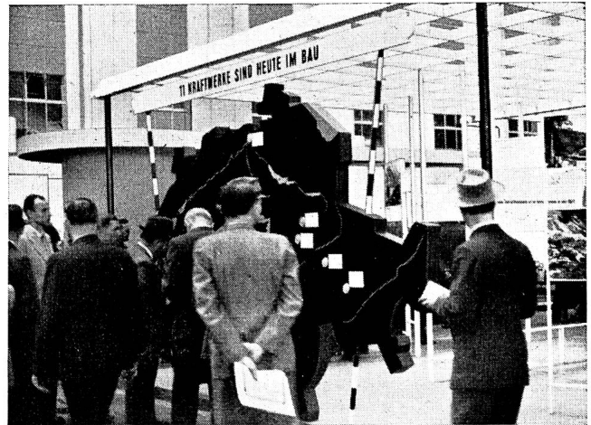
Fig. 11 Die Schweizer Landkarte mit eingetragenen Kraftwerken, die im Bau sind, fand reges Interesse.

Dieses Jahr hat man bei der Ausgestaltung des Kollektivstandes einen neuen Weg beschritten. Bisher wurde immer nur die zweckmässige Anwendung der Elektrizität im Haushalt, Gewerbe und in der Industrie mit praktischen Vorführungen gezeigt. Diese Art von Beratung und Werbung hatte sich sehr gut bewährt. Da nun aber durch die zeitweiligen Einschränkungen im Elektrizitätsverbrauch kritische Stimmen gegen die Elektrizitätswirtschaft laut wurden und die Meinung aufkam, es werde in der Beschaffung weiterer Elektrizität nichts getan, wollte man