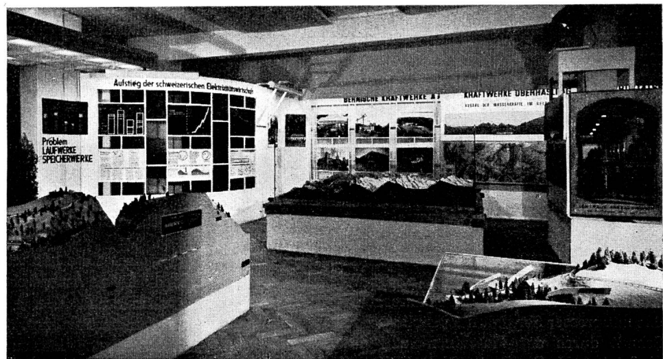
Fig. 9 Ein anderer Aspekt der Schau in Bern. Links im Hintergrund erkennt man einige Darstellungen über allgemeine energiewirtschaftliche Fragen.