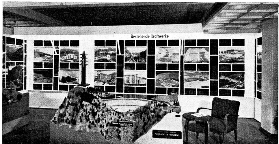
Fig. 8 Die Ausstellung, wie sie sich in Bern präsentierte.